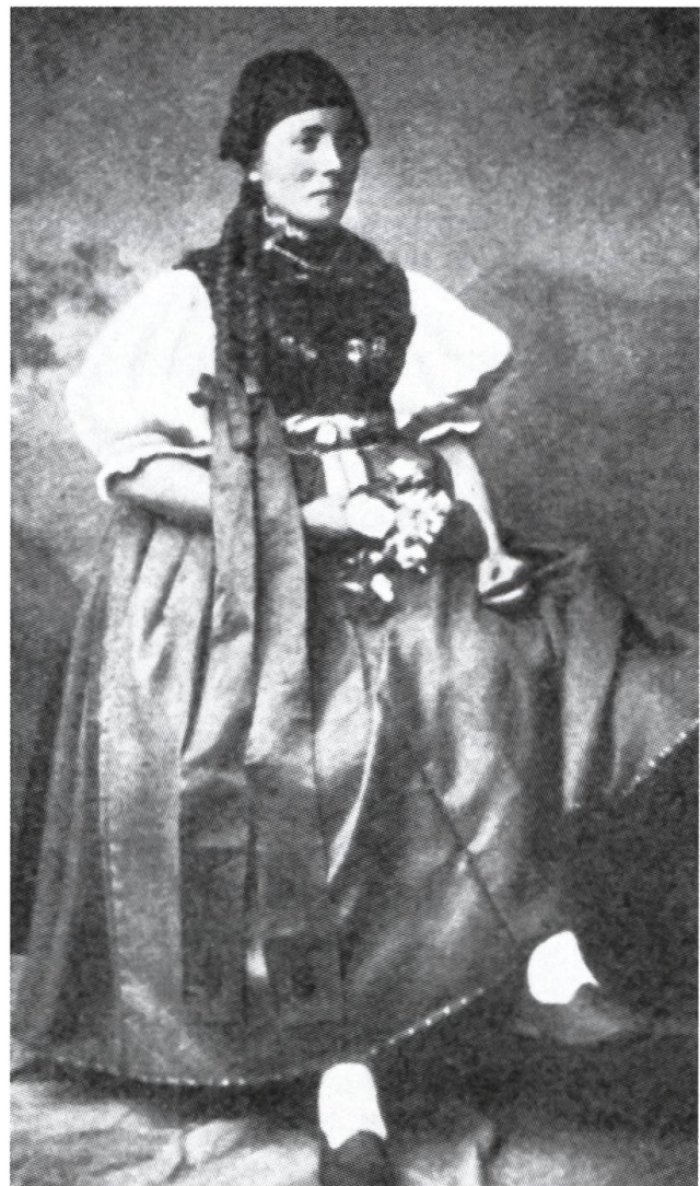
Abb. 5: Die Metzger-Fine von Bergalingen DE in ihrer Seidentracht, die sie in Karlsruhe DE bei der Fürstenhochzeit trug.

17. Jahrhunderts bis etwa 1850 waren piemontesische Tabulettkrämer regelmässig als Hausierer in der Gegend anzutreffen. Auf den abgelegenen Siedlungen war man froh, wenn man nicht für jede Kleinigkeit den Weg ins Tal unter die Füsse nehmen oder den nächsten