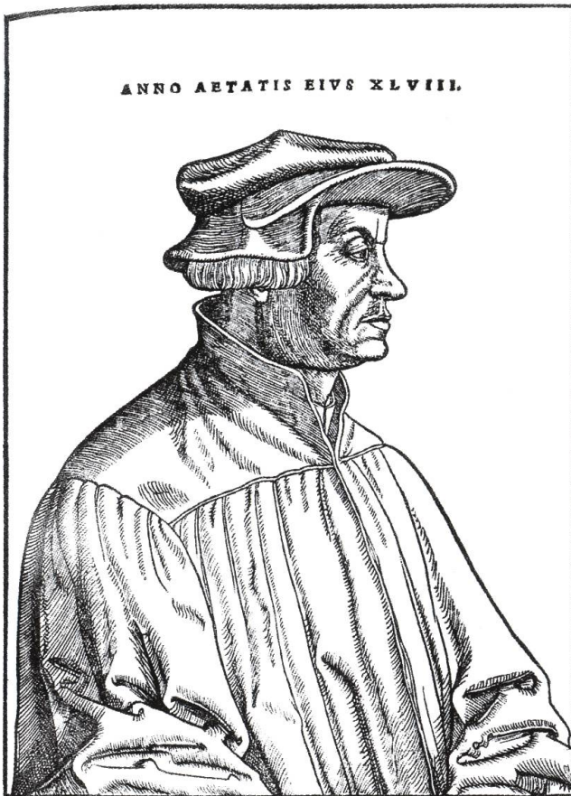
Abb. 4: Der Zürcher Reformator Ulrich Zwingli war Vorbild und Weggefährte Hubmaiers. Der Schritt zum Täuferium bedeutete jedoch den Bruch mit Zwingli.

(Bild: Anonymer Holzchnitt 1532; in: Leopold von Ranke: Deutsche Geschichte im Zeitalter der Reformation , Zürich)