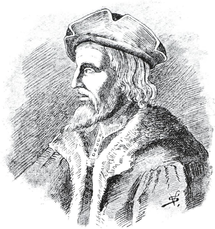
Abb. 3: Balthasar Hubmaier war Pfarrer an der oberen Kirche in Waldshut. Unter seiner Führung bekannte sich die Stadt 1524 zum neuen Glauben. Ein Jahr später wagte er den radikalen Schritt zu einer täuferisch orientierten Reformation. Nach seiner Niederlage musste er fliehen und endete in Wien auf dem Scheiterhaufen.

humanistischen und reformatorischen Zeitgenossen, etwa mit Johannes Ökolampad (1482–1531) in Basel oder mit Ulrich Zwingli (1484–1531) in Zürich (Abb. 4). Im Mai 1523 traf er ein erstes Mal mit Zwingli zusammen und unterhielt sich mit ihm über die folgenreiche Frage der Kindertaufe. Im Oktober des gleichen Jahres beteiligte er sich aktiv an der zweiten Zürcher Disputation, einer wichtigen Wegmarke der dortigen Reformation. Da verlangten die österreichischen Behörden von der Stadt Waldshut, ihren Pfarrer Hubmaier an den Bischof von Konstanz auszuliefern. Die Stadt jedoch weigerte sich und verwies dabei auf ihre Autonomie. Damit wagte ausgerechnet die Stadt Waldshut, die sich bisher durch ihre Treue zum Hause Österreich ausgezeichnet hatte, den Konflikt mit ihrem Landesherrn. Am Pfingstmontag des Jahres 1524 erklärte sich die Bürgerversammlung für den neuen Glauben. Die altgläubigen Geistlichen mussten die Stadt verlassen. Waldshut wurde so die erste reformierte Stadt in österreichischem Gebiet. Ende Oktober zerstörte sie, wie kurz zuvor Zürich, die Bilder in den Kirchen. Österreich konnte vorerst nicht militärisch eingreifen, da seine Kräfte durch an-