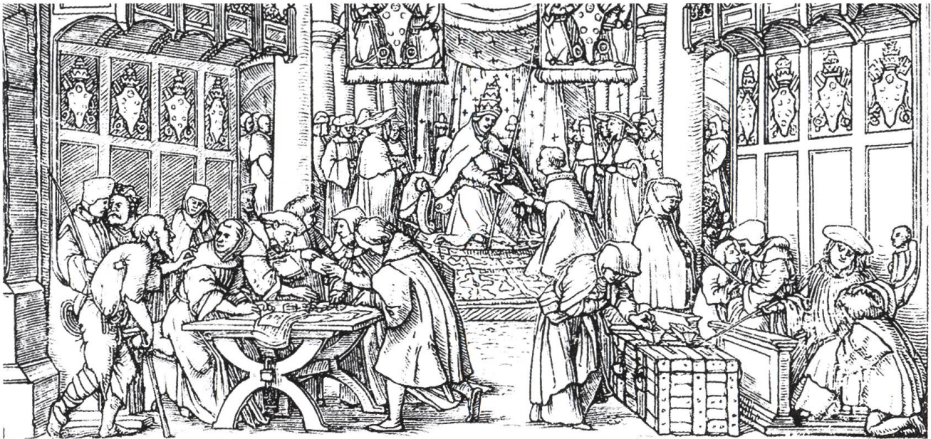
Abb. 2: Der Ablasshandel war nur einer der Missstände der alten Kirche, welche von den Verfechtern der Reformation angeprangert wurden.

(Bild: Teil eines Holzschnittes von Hans Holbein d. J.; in: Leopold von Ranke: Geschichte im Zeitalter der Reformation, Zürich)