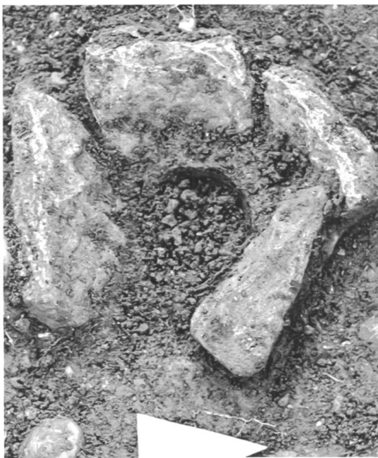
Abb. 4 Möhlin, Brunnngasse 6. Das unvollständige Gefäss aus dem 13. Jh. hat einen Durchmesser von rund 15 Zenti- metern.