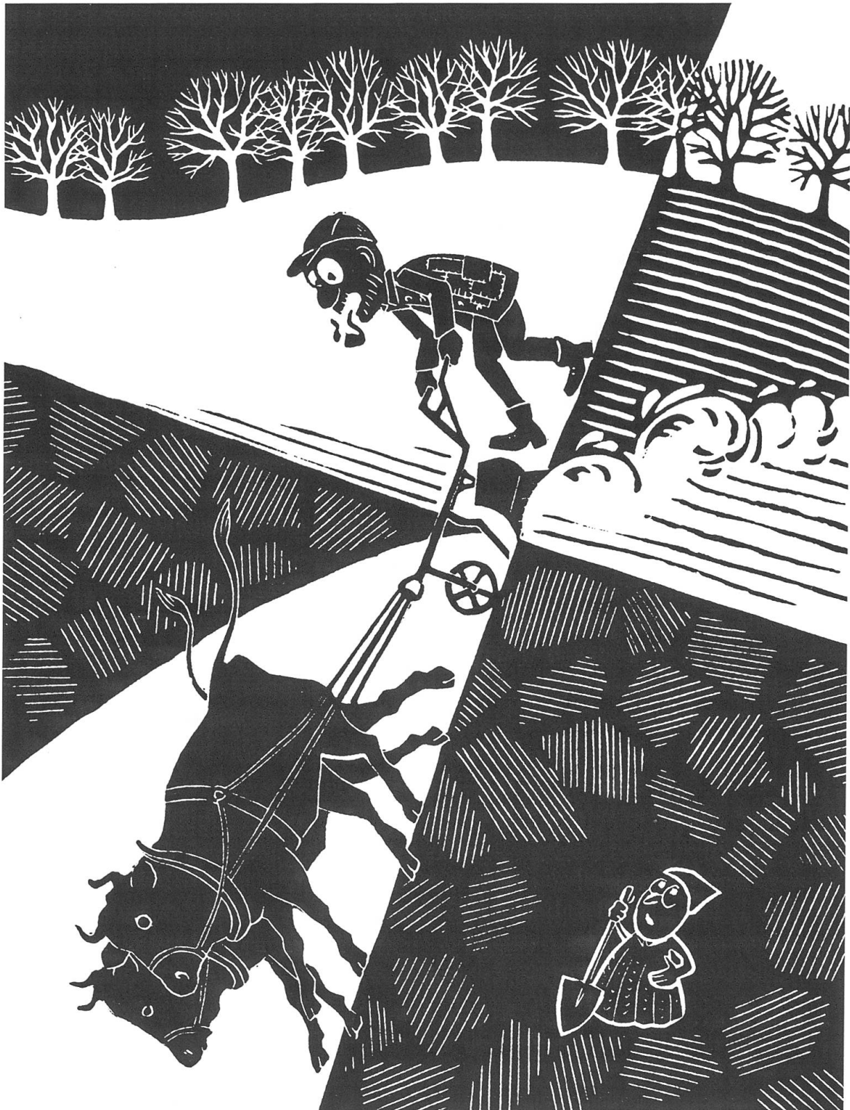
Die Rache der Erdmännlein