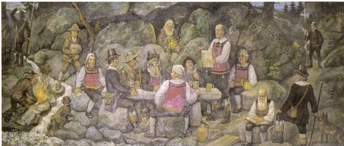
Heimliche Versammlung der Salpeterer (Gemälde von Adolf Glattacker, 1962. Standort: Hochschwarzwaldklinik St. Blasien).

rioden, Ereignisse oder Persönlichkeiten ist nicht allein in ihren Ausdrucksformen sehr verschieden. Auch die Deutungen unterliegen einem ständigen Wandel. Derartige Veränderungen sind nicht allein mit neuen Erkenntnissen begründbar, die zum Beispiel ein bis dahin nicht möglicher Zugang zu Quellen verhinderte. Es verändern sich auch Gesellschaften und mit ihnen Norm- und Wertmassstäbe. An der Darstellung von zum Beispiel sozialen Bewegungen wie bäuerlichen Unruhen, zu denen die Salpeterereignisse gehören, ist das gut nachweisbar. 22 Die Rezeptionsgeschichte wird, wenn an derartige Veränderungen gedacht wird, zu einem eigenen – und wie ich meine, hochinteressanten – Forschungsgebiet innerhalb der wissenschaftlichen Disziplinen. 23 So wie sich in allen anderen Bereichen einer Kultur von Generation zu Generation Darstellungsformen wandeln, denken wir allein an die bildenden Künste oder die musikalischen Ausdrucksformen, so verändert sich auch unser Blick auf historische Phänomene. Über diese Veränderungen wird im Schlusskapitel noch einmal nachgedacht.