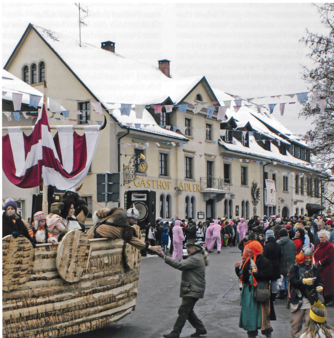
Abb. 3 Der «Adler» in Gornalpe hat eine jahrhundertealte Tradition als Gasthof und auch als Gerichts- stätte. Auch wenn, wie hier am Faschnachts- montag, ein Narren- schiff vorbeifährt, im «Adler» ging es ehedem um ganz ernsthafte Angelegen- heiten wie die Bewahrung der eigenen Gerichts- barkeit innerhalb der Hauensteiner Einungsverfassung.