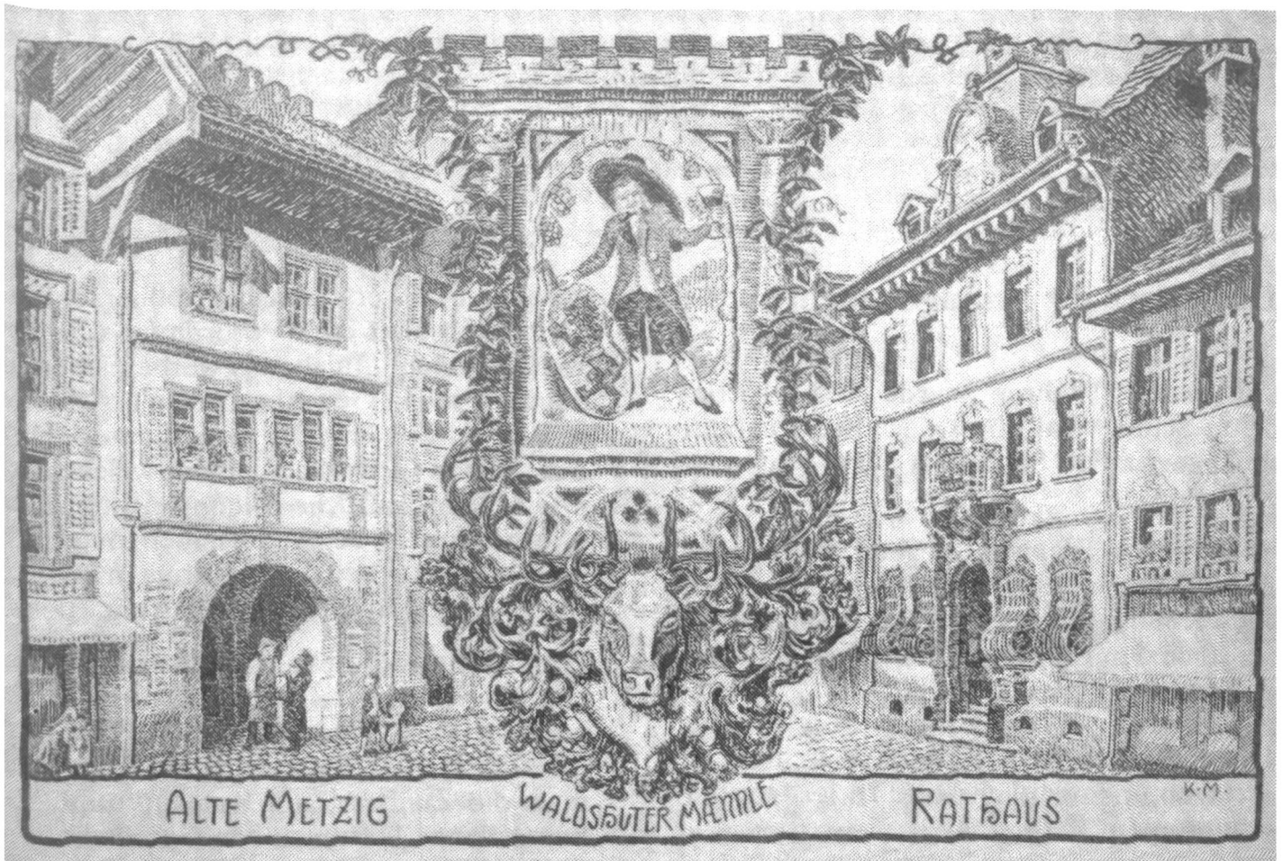
Abb. 2 Waldshut, «Alte Metzsig» (Metzgertörle), erstes Schulgebäude der Gewerbeschule 1837.

Anfangs fand der Unterricht noch im Haus Alte Metzsig (Metzgertörle) in der Kaiserstrasse statt, da die eigentlich vorgesehenen Unterrichtsräume im 1575 erbauten alten Kornhaus beziehungsweise Zunfthaus erst noch hergerichtet werden muss-