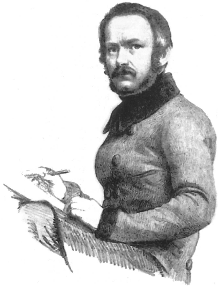
Abb. 1 Erhard Joseph Brenzinger, Selbst- porträt von 1846.

gens eingerichteten Gewerbeschulfonds flossen. Mit Urkunde vom 4. Januar 1837 übereignete unter anderem die Waldshuter Herrenstuben-Gesellschaft ein Kapitalvermögen sowie eine Liegenschaft (Wohnung) im Gesamtwert von 1800 Gulden. Die Wohnung konnte entweder für die Abhaltung des Unterrichts selbst oder zur Unterbringung eines bei der Schule angestellten Lehrers genutzt werden. Damit die edle Stiftung respektive die Stifter selbst nicht in Vergessenheit gerieten, wurde der Gewerbeschule dabei folgende Auflage gemacht: