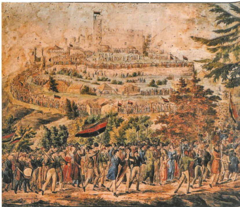
Abb. 3 Erhard Joseph Brenzinger, «Der Zug zum Hambacher Schloss», 1832.

Weit bis in die zweite Hälfte des 20. Jahrhunderts hinein hatte die Textilindustrie in unserer Gegend dominiert. Doch mit der Nutzbarmachung der Wasserkräfte des Rheins und seiner Nebenflüsse um 1900 entstanden nach und nach weitere Industriezweige. Die chemische sowie die metallverarbeitende Industrie prägten zunehmend die hiesige Wirtschaft. Mithin veränderten sich durch die an die Arbeitskräfte gestellten höheren Anforderungen auch die an der Gewerbeschule vermittel-