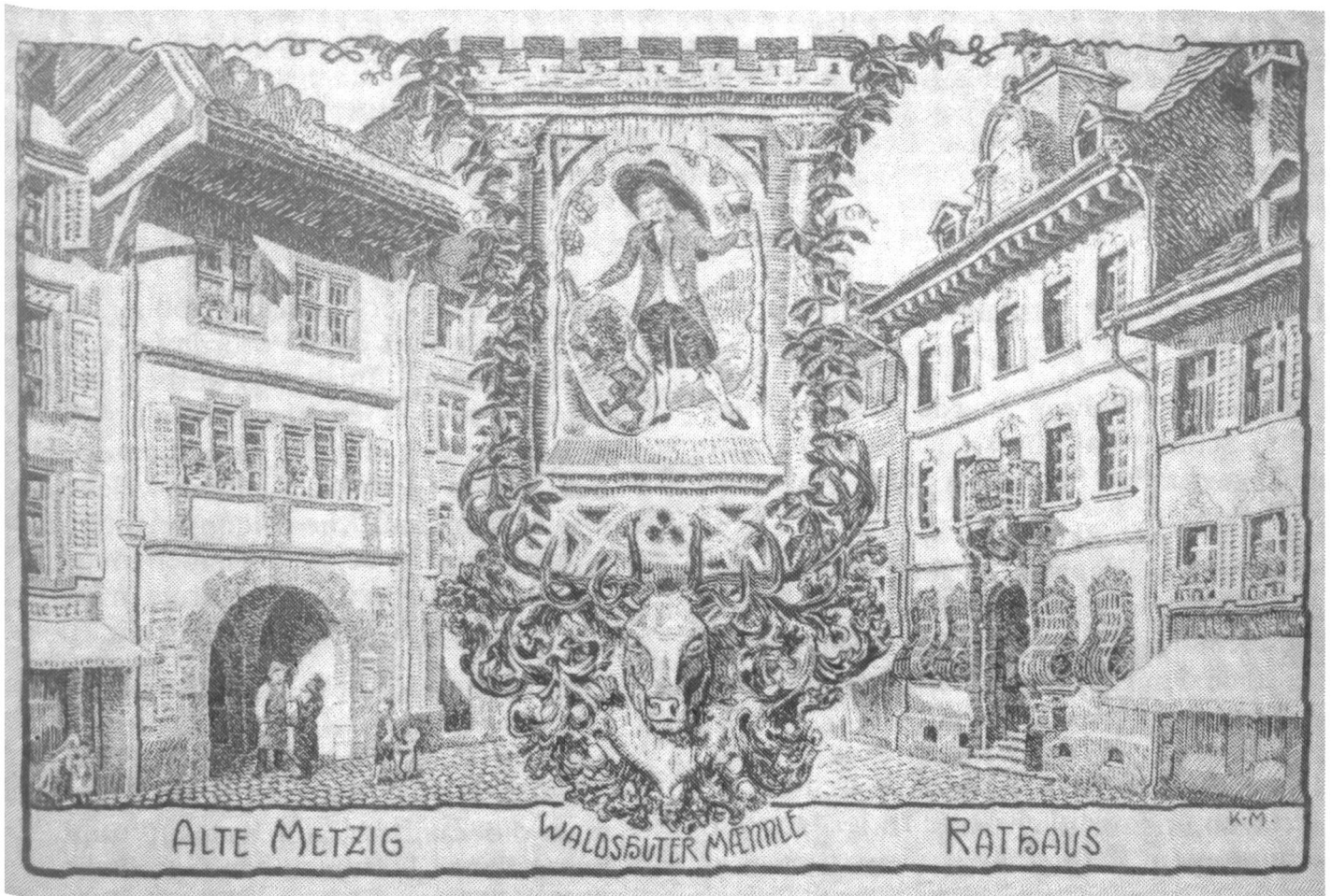
Abb. 2 Waldshut, «Alte Metzsig» (Metzgertörle), erstes Schulgebäude der Gewerbeschule 1837.

Anfangs fand der Unterricht noch im Haus Alte Metzsig (Metzgertörle) in der Kaiserstrasse statt, da die eigentlich vorgesehenen Unterrichtsräume im 1575 erbauten alten Kornhaus beziehungsweise Zunfthaus erst noch hergerichtet werden muss-