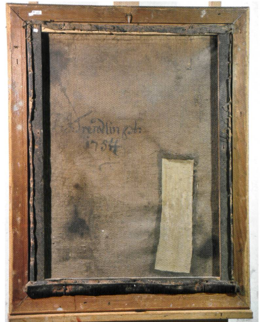
Abb. 1 und 2 Zustand des Gemäldes bei Empfang im Frühjahr 2013. Gesamtaufnahmen der Vorder- und Rückseite im Zierrahmen.