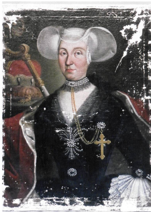
Abb. 7 Zustand nach Kittung der Ausbruchstellen und Wiederaufspannen auf den neuen Rahmen.

Zur Konsolidierung der Malschicht wurden lose Farbschollen mit Glutinleim (Hausenblasenleim) gefestigt. Das flüssige Bindemittel konnte unter aufstehende Schollen injiziert und nach dem Antrocknen des Leimes mit Druck und Wärme des Heizspachtels auf das Gewebe rückfixiert werden. Gereinigt wurde die Oberfläche zunächst durch eine Feuchtreinigung mit Wattetampon beziehungsweise Mikroporenschwämmchen und Wasser mit einem Zusatz von nichtionischem Tensid. Die Abnahme der grossflächigen, harten und