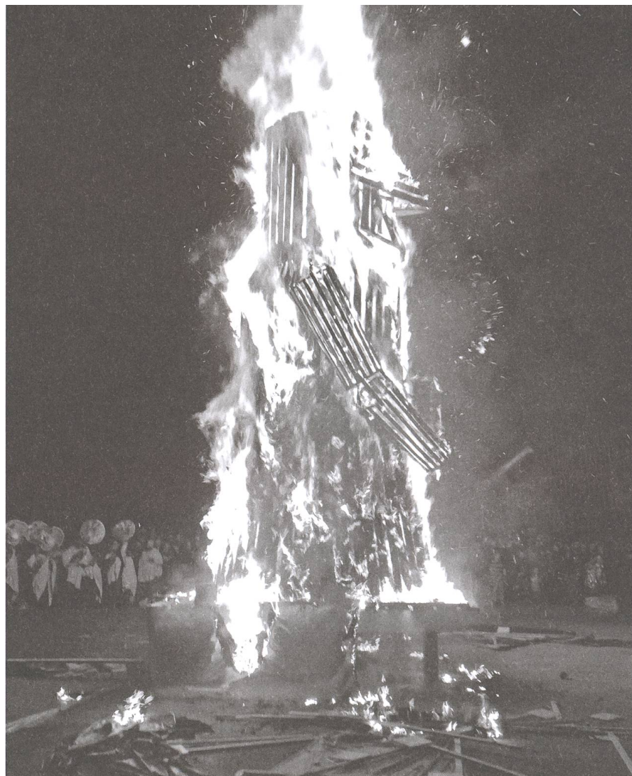
Abb. 1 Chluuri-Verbrennung in Sissach 2012.

Der Rückgang dieses Brauches hat viele Ursachen. Durch Binnenmigration und zunehmende Bautätigkeit wurden die gefestigten, eingeschworenen Strukturen der Dorfbevölkerungen durchbrochen, die Konkurrenzsituation zwischen Dorfteilen und Quartieren als wichtige Voraussetzung für den Wettbewerb zweier Gruppen flachte ab, und die Jungen verloren die Motivation für die aufwendigen Vorbereitungsarbeiten (Scheidegger 1989). Hinzu kamen Feuerverbote wegen Brandgefahr in den wachsenden Siedlungsräumen. In den 50 Jahren zwischen etwa 1880 und 1930 verschwanden in den meisten Ortschaften die alten Feuerbräuche der Fasnachtszeit ganz aus dem Alltagsleben, zuerst in den Städten, dann in den Dörfern. Am besten konnten sich diese Traditionen in Reliktgebieten halten, und dort am ehesten, wenn sich die Brauchstrukturen durch innovative Veränderungen dem Zeitgeist anpassten. Für das Wittnauer Fasnachtsfeuer waren diese Voraussetzungen gegeben: Etwas abgeschieden von grossen Zentren hinten im Tal gelegen,