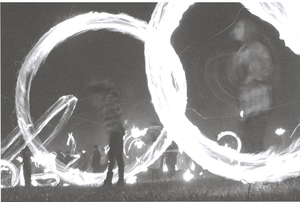
Abb. 2 Fachtelschwingen am Fachtelzug.

Erleichtert wurden diese Kreationen durch weitere Neuerungen. Kannte man vor 150 Jahren nur die aufwendig aus Kien, Harz und Pech selbst hergestellten Fackeln für die Feuerzeichen, erleichterte später das Steinöl (Petroleum) die zeitraubende Herstellung der Fackeln, die allmählich durch die Petrol-«Fächteli» abgelöst wurden. | Abb. 2 |