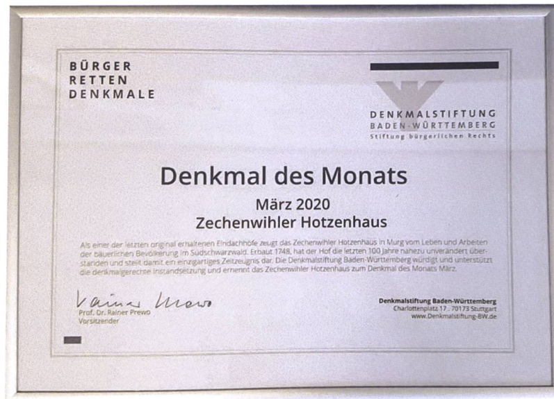
Abb. 11 Anerkennung von der Denkmalstiftung: Das Zechenwihler Hotzenhaus wird Denkmal des Monats März 2020.

Das Zechenwihler Hotzenhaus wurde als Denkmal von besonderer Bedeutung eingestuft und ist damit in der gleichen Kategorie wie die Säckinger Holzbrücke oder das Freiburger Münster gelistet.