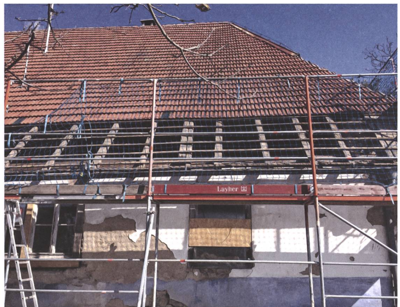
Abb. 10 Dach und Fassaden werden saniert und ausgebessert, damit das Denkmal im Herbst 2020 in neuem Glanz erstrahlt.