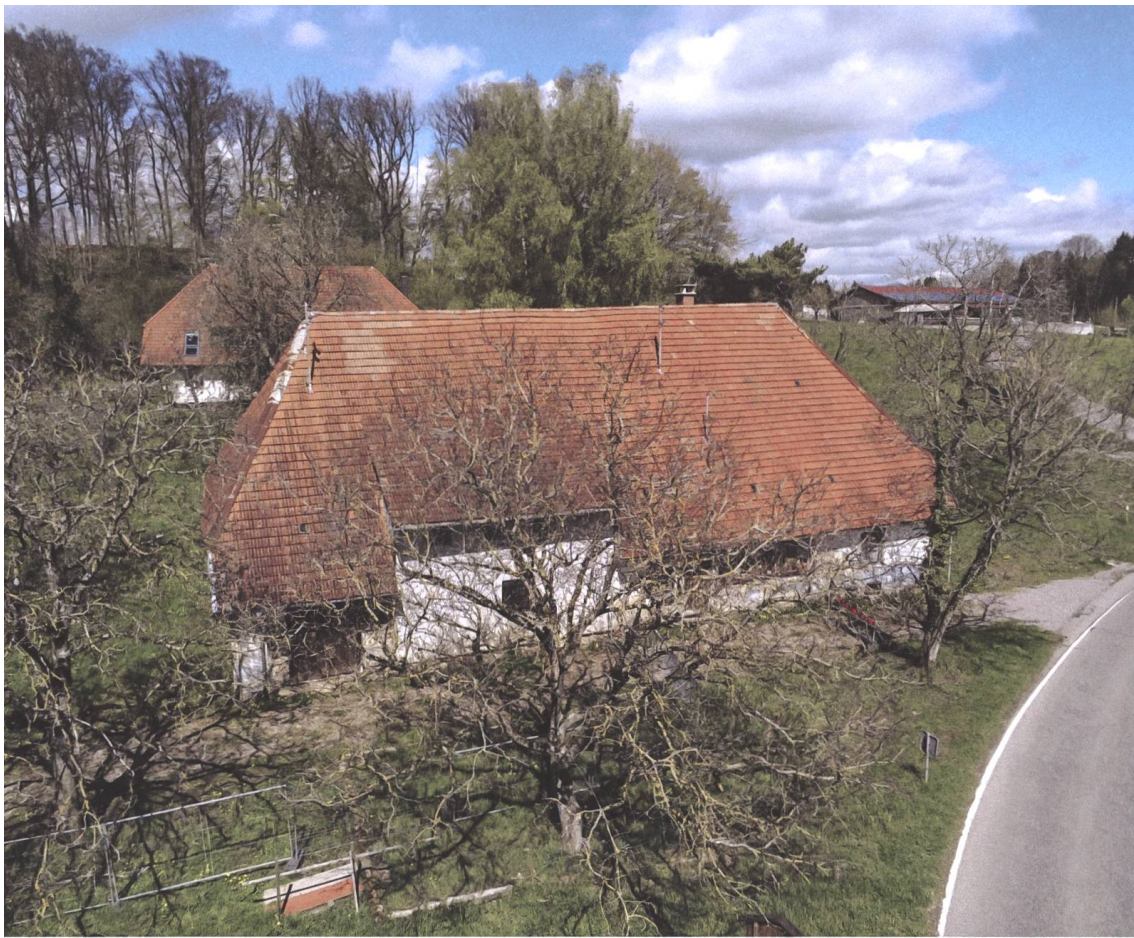
Abb. 5 Das Zechenwihler Hotzenhaus liegt inmitten einer für den Denkmalschutz vorbehaltenen Fläche. Dadurch wird seine Bedeutung gefestigt. Veranstaltungsflächen, Streuobstwiese, Blumenwiesen und Bauergärten fügen sich zukünftig als Mosaiksteine in die Landschaftsgestaltung ein, um das Denkmal zu umrahmen.

So wird zukünftig garantiert, dass das hochrangige Denkmal auch in seiner historischen landschaftlichen Einbettung erlebbar bleibt.