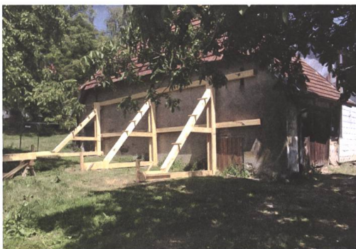
Abb. 9 Temporäre Bausicherungen aus Holz stabilisieren das Hotzenhaus während der Umbaumaassnahmen.

Wir als Vereinsmitglieder haben viel gelernt in diesen Jahren, viele fachliche Dinge; aber auch, dass man im Denkmalschutz Beharrlichkeit und einen langen Atem braucht.