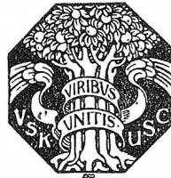
Schutzmarke des V. S. K.

Alle Eigenpackungen des V. S. K. sind mit dessen Schutzmarke versehen.