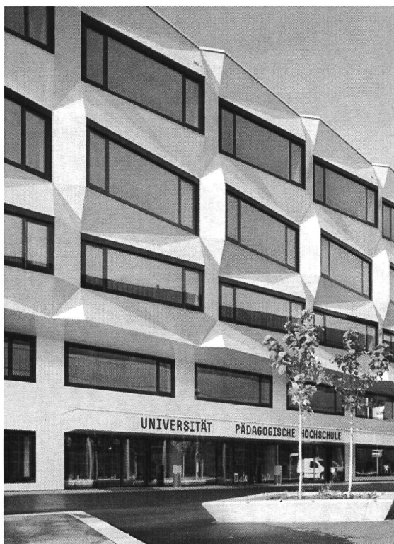
Abb. 2: Eingangsbereich.

fläche und wurde silbern gespritzt. Es dient nicht nur der Erschliessung der verschiedenen Stockwerke (wir haben nur einen kleinen Personenlift im Haupttreppenhaus, da die nicht behinderten Studierenden die Treppen benutzen sollen: ein bescheidener, aber wirkungsvoller Beitrag zur Gesundheitsförderung), sondern hat sich auch als Begegnungsort etabliert.