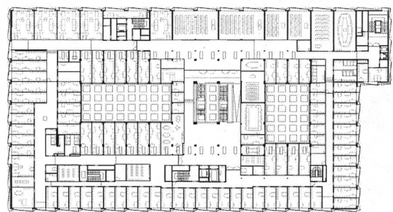
Abb. 4: Grundriss 4. OG.

Insgesamt konnte das Kostendach von rund 145 Mio. Franken, an welche der Bund den Anteil für die Universität mit 50 Mio. Franken subventionierte, eingehalten werden. Rechnet man die Bauteuerung dazu, wurden gar rund 6 Mio. Franken weniger verwendet als kreditiert. Die Albert Koechlin-Stiftung schenkte der Universität für die Räumlichkeiten der Rechtswissenschaftlichen Fakultät 15 Mio. Franken, zu Ehren des Stifters wurde darum das Audimax «Rudolf Albert Koechlin Auditorium» benannt. Die Stadt Luzern leistete einen Standortbeitrag von 8 Mio. Franken, der Anteil des Kantons betrug für die Universität rund 37 Mio. Franken, für die Pädagogische Hochschule rund 33 Mio. Franken.