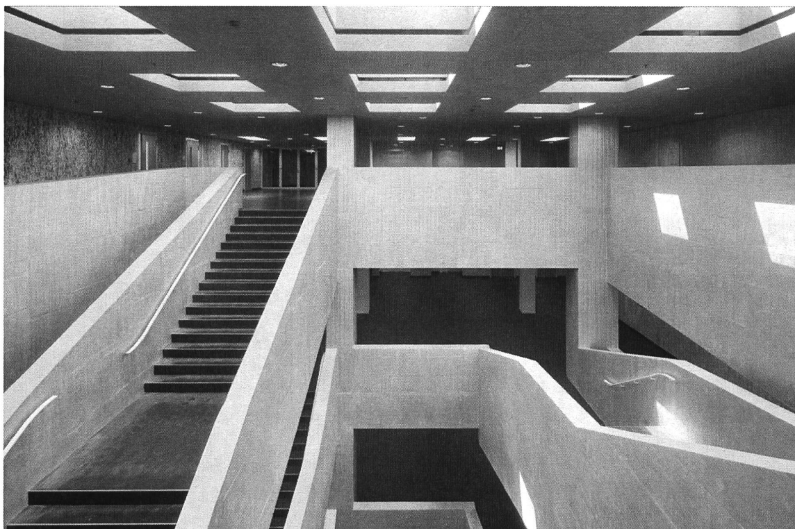
Abb. 5: Treppenhaus.

Zylinder. Damit wurden zwar Baukosten gespart (weil die Verkabelung nicht an alle Türen geführt werden musste), das tägliche Handling der Zutrittsberechtigungen verursacht jedoch einen hohen Aufwand. Gerade an einer Universität mit einer überdurchschnittlich hohen Personalfuktuation (Assistenten und Hilfsassistenten sind nur befristet angestellt und es gibt einen hohen Wechsel) sind diese Aufwendungen beträchtlich. Jetzt werden Nachrüstungen installiert, die es wenigstens ermöglichen, das Gebäude jederzeit ohne das Auslösen eines Gebäudehüllenalarms zu verlassen.