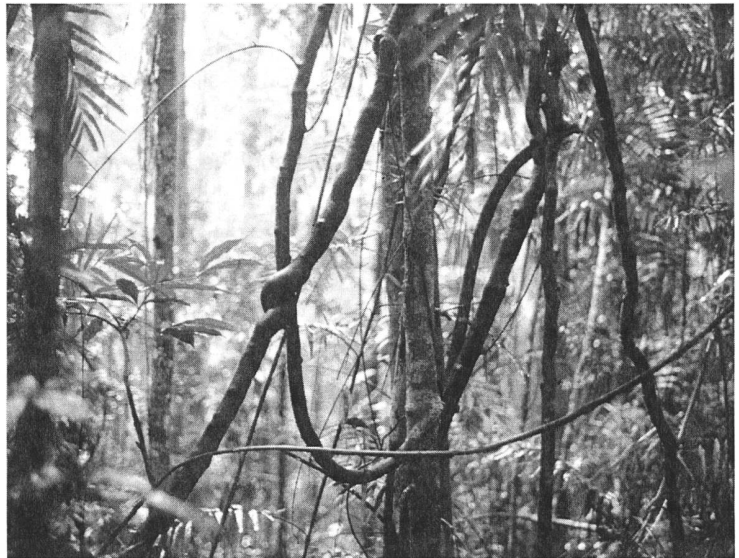
Abbildung 4. Lianen spielen eine entscheidende Rolle bei der Frage, wieviel Kohlenstoff Tropenwälder speichern. Je aggressiver Lianen werden, desto dynamischer wird der Wald und desto niedriger ist der mittlere Kohlenstoffvorrat. Lianen wurden tatsächlich in den letzten Jahrzehnten ‚wüchsiger‘. So kann eine Wachstumsförderung einer Pflanzengruppe das C-Kapital des Ökosystems reduzieren, während gleichzeitig mehr C-Umsatz herrscht (Körner 2009b).

Das Kyoto Protokoll fördert Aktivitäten zur Wiederbewaldung (Körner 2003b). Daran ist ökologisch nichts schlecht. Wenn man aber bedenkt, dass es bis zu 200 Jahre dauert, bis auf einer Rodungsfläche wieder der ursprüngliche C-Vorrat steht, wäre ein Schutz der bestehenden, vorratsreichen Altwälder viel wichtiger als neuer Jungwald. Der nötige nachwachsende Rohstoff Holz sollte also nicht durch «Mineure» (ohne vorherige Investitionen) aus alten Wäldern geholt werden, sondern nachhaltig aus Plantagen bezogen werden. Europa macht das seit Jahrhunderten. Alle unsere Wälder in Europa, mit Ausnahme schwer zugänglicher, entlegener Steilhänge, sind Plantagen. Kaum jemand hat je eine ausgewachsene Fichte (Rotanne) gesehen. Diese Baumart kann 70 m hoch werden, einen Stammdurchmesser von 1.6 m haben und 600 Jahre alt werden. Was wir im Wald sehen, sind «jugendliche» Bäume von meist weniger als 120 Jahren Alter, in einer für die Nutzung handlichen Dimension.