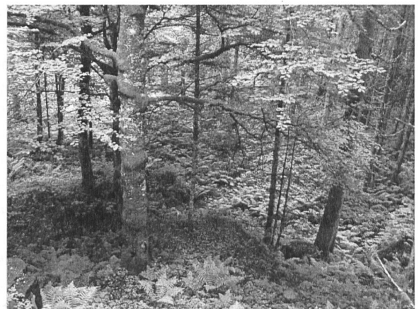
Abbildung 1. Pflanzen entnehmen der Luft im Wege der Photosynthese CO 2 und alle nicht-grünen Pflanzenteile, Tiere und Mikroben befördern das CO 2 durch Atmungsprozesse wieder in die Atmosphäre zurück. Dieser natürliche Kreislauf des Kohlenstoffs ist langfristig und grossräumig weitgehend geschlossen und die Bilanz ist nahezu ausgeglichen.

Das Objekt dieses Beitrages gehört sowohl zur belebten als auch zur unbelebten Umwelt, es kreist zwischen den beiden Umwelten: Das Element Kohlenstoff (C) in seiner oxidierten Form, das Kohlendioxid, kurz CO 2 . Seit über 200 Jahren ist bekannt, dass Pflanzen quasi ‹Luft essen›, also sich ihre Körpersubstanz hauptsächlich aus dem CO 2 der Luft im Wege der Blattphotosynthese holen. Über den Atmungsprozess aller Organismen, insbesondere auch der mit recycling beschäftigten Bakterien, gelangt CO 2 wieder in die Luft zurück – das ist der biosphärische Kohlenstoffkreislauf. Auch über die Verbrennung von Biomasse (z.B. Wildfeuer) gelangt CO 2 wieder zurück in die Luft. Dieser Kreislauf ist seit Urzeiten weitgehend ausgeglichen, die Aufnahme und Abgabe von CO 2 durch die Biosphäre sind nahezu gleich gross (Abb. 1).