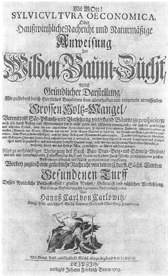
Abbildung 3 a: Titelblatt Carlovitz