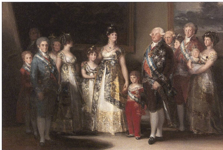
Abbildung 1. Francisco de Goya y Lucientes (1800/1801): La familia de Carlos IV . 15

Solide Sprachkenntnisse bilden eine hervorragende Voraussetzung für das Studium an einer Hochschule, auch an einer technischen Hochschule. Gerade in einer Zeit, in der von den Studierenden verlangt wird, sich in ganz unterschiedlichen Situationen und unter verschiedenen kulturellen Bedingungen eigenständig und kritisch zu positionieren, ist dies von besonderer Bedeutung. Denn Sprachen sind nicht nur Informationsträger, sondern und vor allem Denkmodelle für alternative Welten. Und als solche sind sie ganz selbstverständlich interdisziplinär. 14