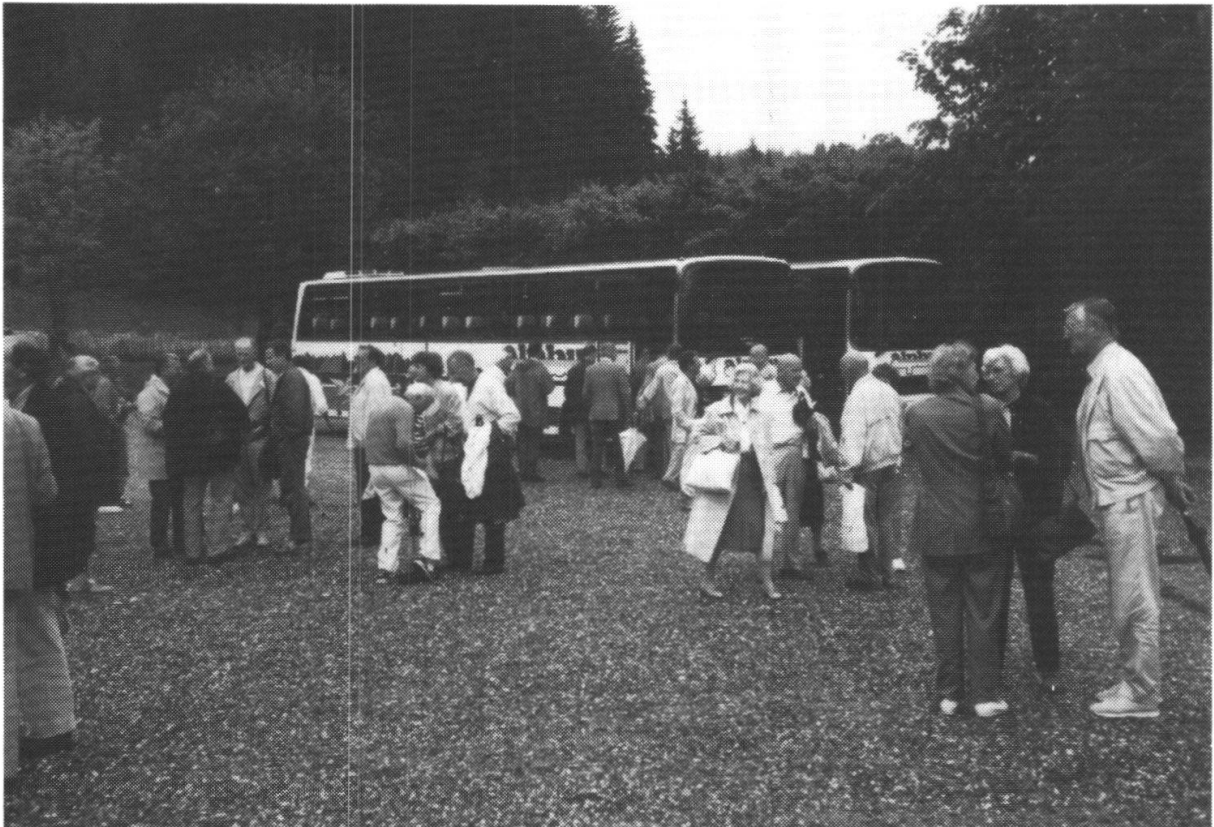
Fig. 3 Angeregte Diskussion in Gruppen