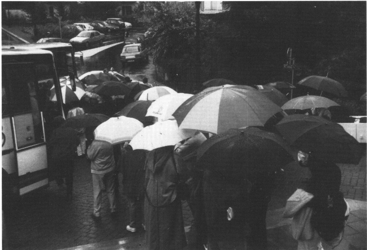
Fig. 2 Start zur Exkursion

Während der Fahrt von Annecy durch die Molasse, dem Westrand der Bornes entlang nach Bonneville und nach Mégève durch das Tal der Arve, welches die Ketten der Bornes quert und einen ausgezeichneten Einblick in den strukturellen und stratigraphischen Aufbau dieser Einheiten gibt, war allerdings die geologische Aussicht meist durch dichten Nebel und tiefhängende Regenwolken verdeckt. Umso mehr freute sich die Gesellschaft beim kulinarischen Mittagshalt an den savoyardischen Spezialitäten im Piano à Bretelles (Handorgel). Bei Kaffee und Tanz, wobei das Ehepaar TRÜMPY den Reigen anführte, liess sich das üble Wetter ganz gut vergessen. Auch die Rückfahrt durch das Authochthon über den Col des Aravis zurück nach Annecy verlief ohne grosse Aussicht auf einen Einblick in die geologischen Geheimnisse dieser Landschaft (Fig. 2). Dies tat aber der allgemeinen Stimmung unter den Teilnehmern absolut keinen Abbruch (Fig. 3 und 4).