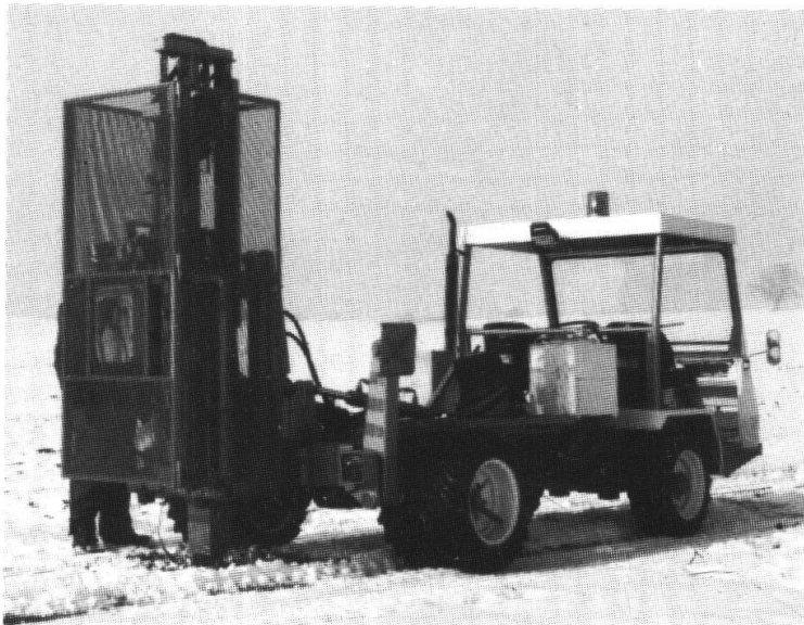
Fallgewicht als umweltfreundliche seismische Anregung