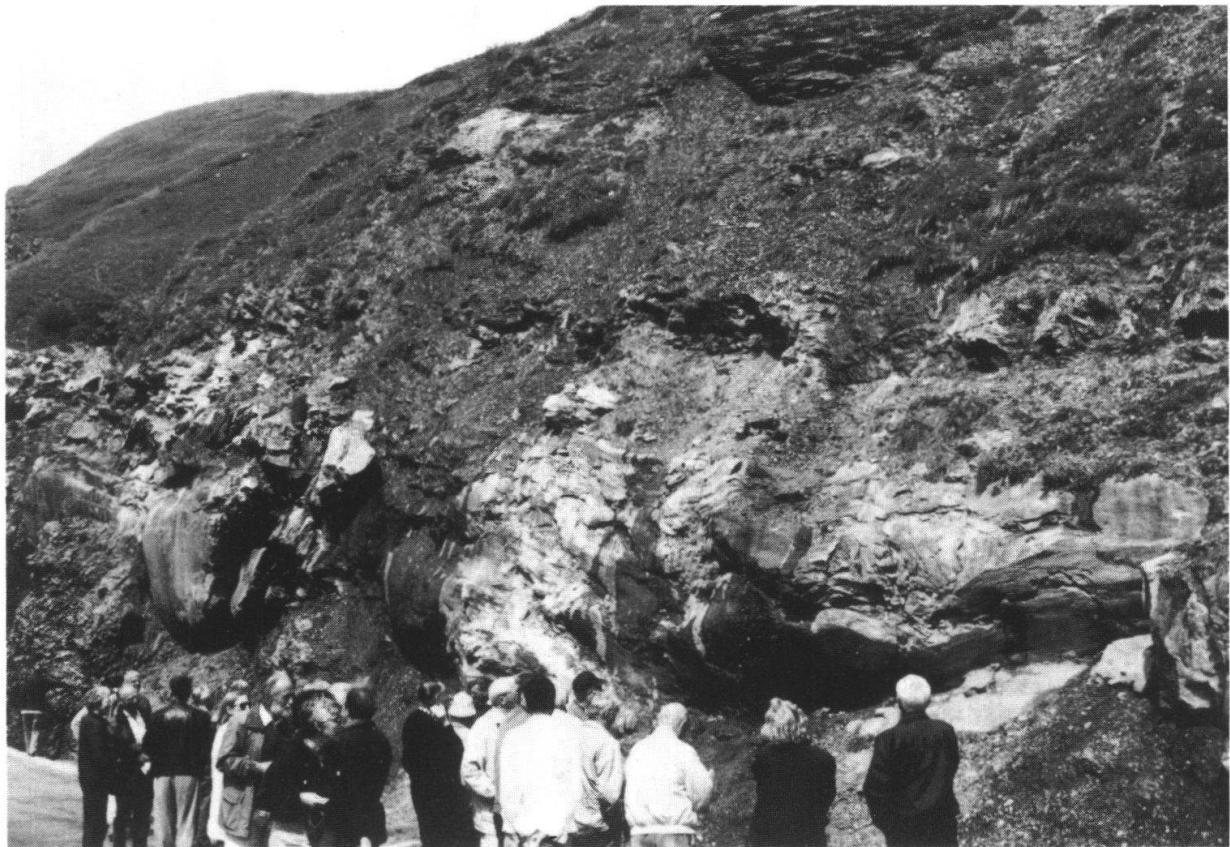
Fig. 5: Die Helvetische Hauptüberschiebung unterhalb des Klausenpasses.