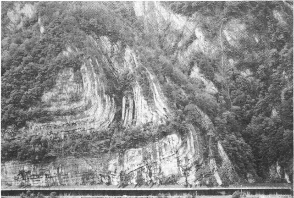
Fig. 2: Synklinal-Umbiegung in den Unterkreideschichten bei der Schiferenegg.