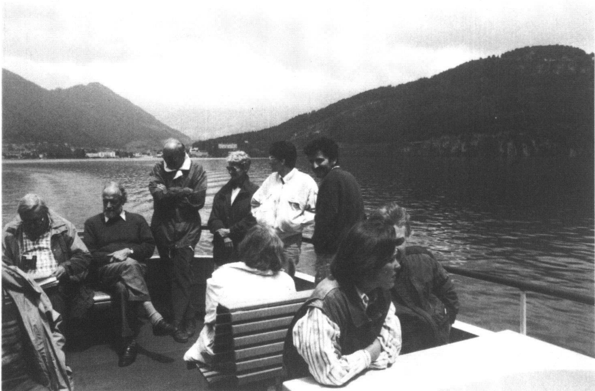
Fig. 3: Gespannt wartet Jung und Alt auf die Fortsetzung der Geschichte über Schiller, Geologie und Goethe.