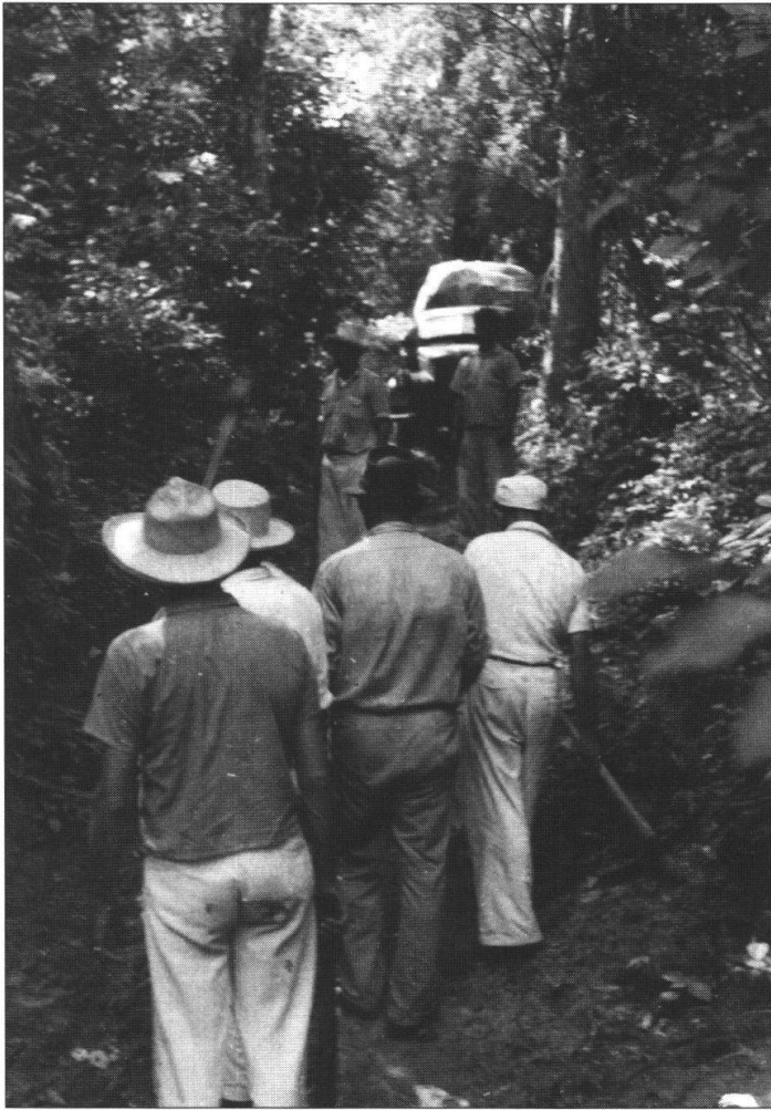
Foto 1: Ende der Fahrt! Zwischen El Laberinto und Cachirí, westlich La Paz, Maracaibo Distrikt. (Aufnahme 1945).