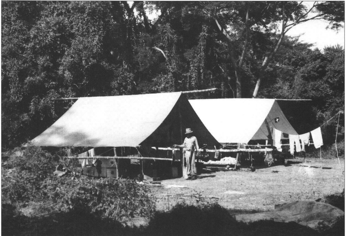
Foto 4: Unser Camp bei El Dibujado am Río Cachirí, Perijá Vorberge. (Aufnahme 1945).