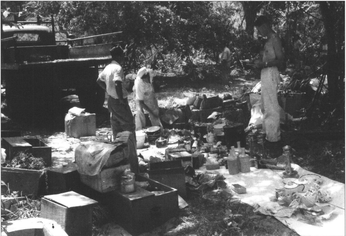
Foto 2: Auslegeordnung und Kontrolle des Materials und der Vorräte vor dem Bepacken der Maultiere. Im Busch nordwestlich El Laberinto. (Aufnahme 1945).