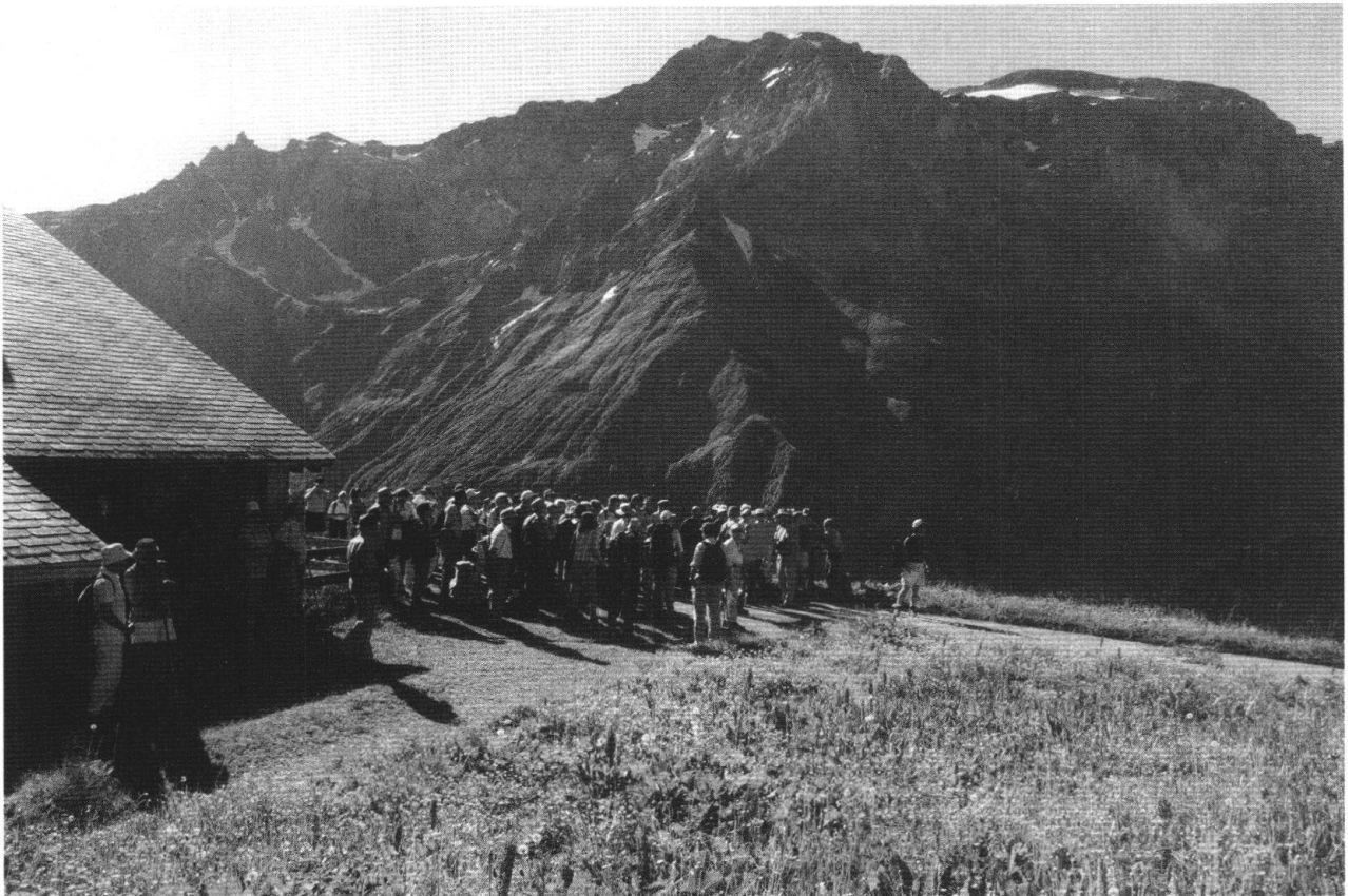
Fig. 1: Auftakt zur Sonntagsexkursion:

Besammlung auf der Erbsalp, einer Hochterrasse zuhinterst im Sernftal.