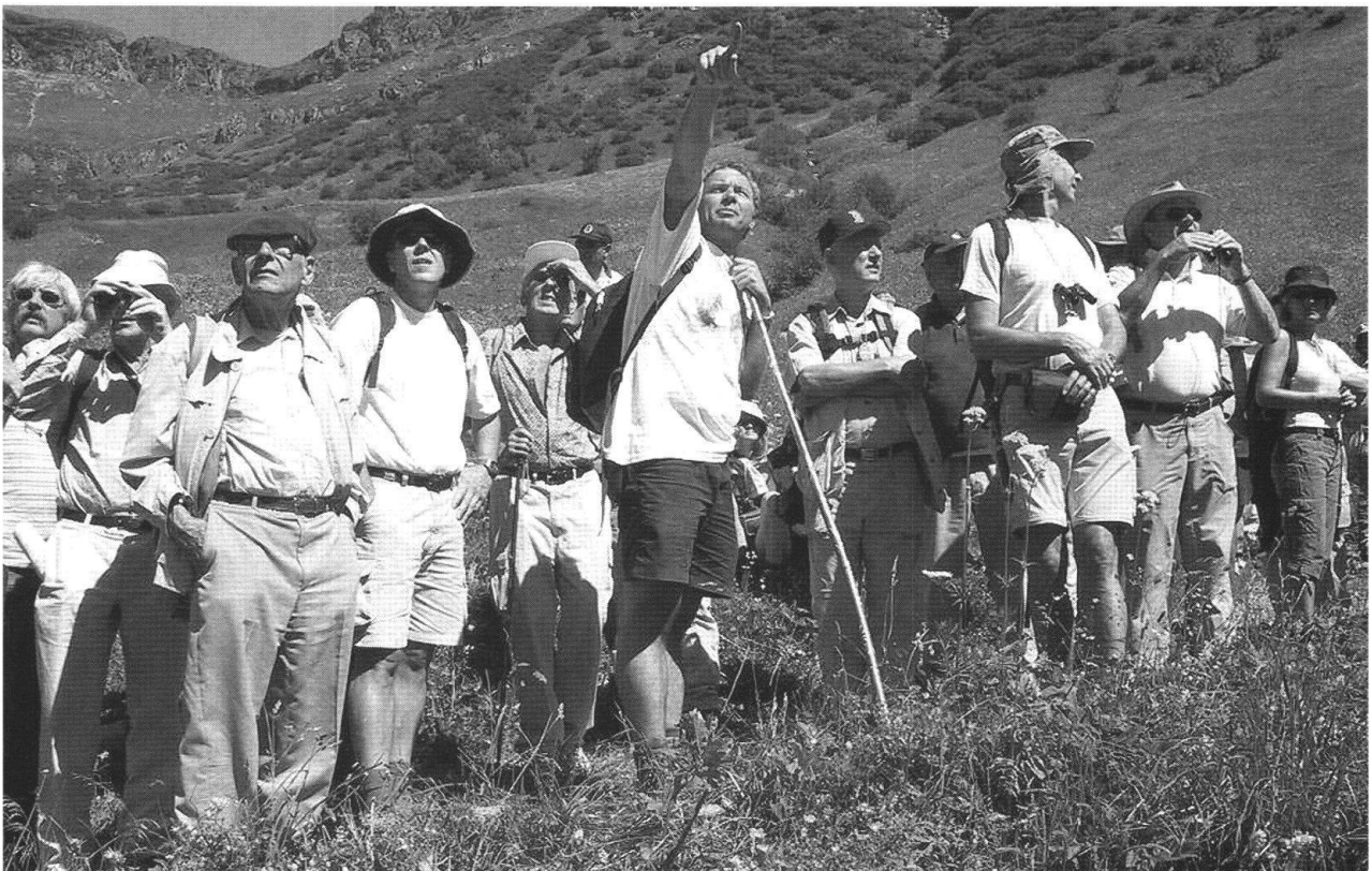
Fig. 3: Wanderung Erbsalp – Ämpächli:

Auf Erbsalp vor der Pyramide des Glarner Hausstocks, präsentiert Prof. Trümpy mit prägnanten Profilskizzen das Kernstück der Glarnergeologie, die Glarner Überschiebung. Das Sernftal ist hier tief in den zerfurchten Glarnerflysch eingeschnitten. Der Verrucano der Glarnerdecke bildet die Gipfelkappen rund um das Tal. Der Lochseitenkalk erscheint als helles, zerrissenes Band zwischen Flysch und Verrucano.