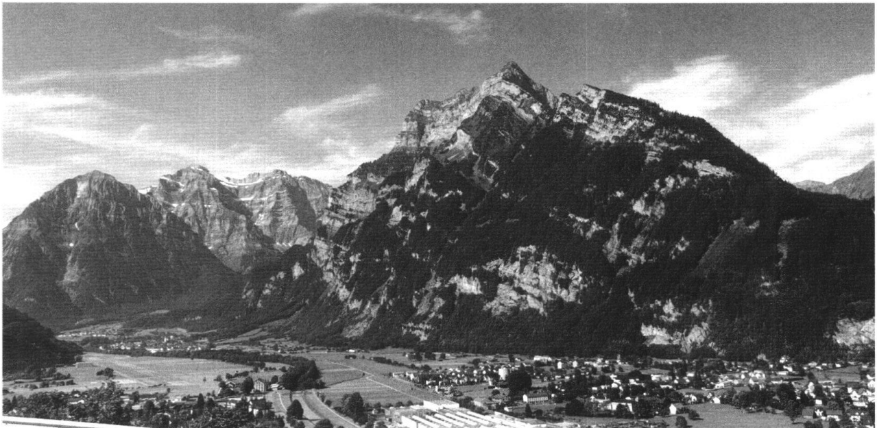
Fig.7: Beglingen Panorama:

Bei Beglingen hoch über der Talebene von Näfels gibt Prof. Trümpy einen Überblick über den Deckenbau des Glärnisch und des Wiggis. Auch kommt die Linthkorrektur von Hans Conrad Escher zur Sprache. Es folgt der obligate z'Nüni mit Kaffee und Gipfeli im Restaurant Römerturm, dazu Panoramageologie der gegenüber liegenden Bergkette, vom Speer über die Amdener Mulde zu den Churfürsten.