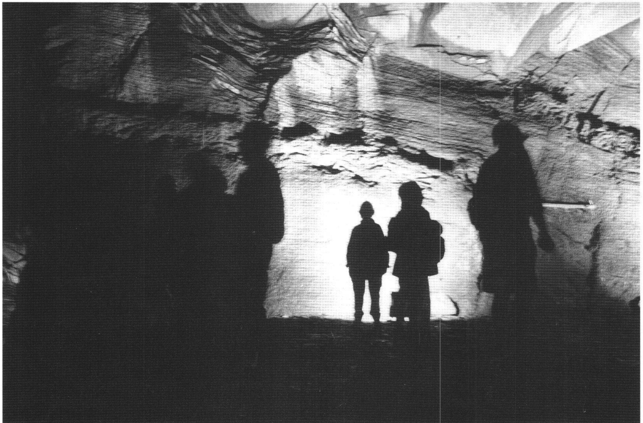
Fig. 5: Besuch des Landesblattenberg: