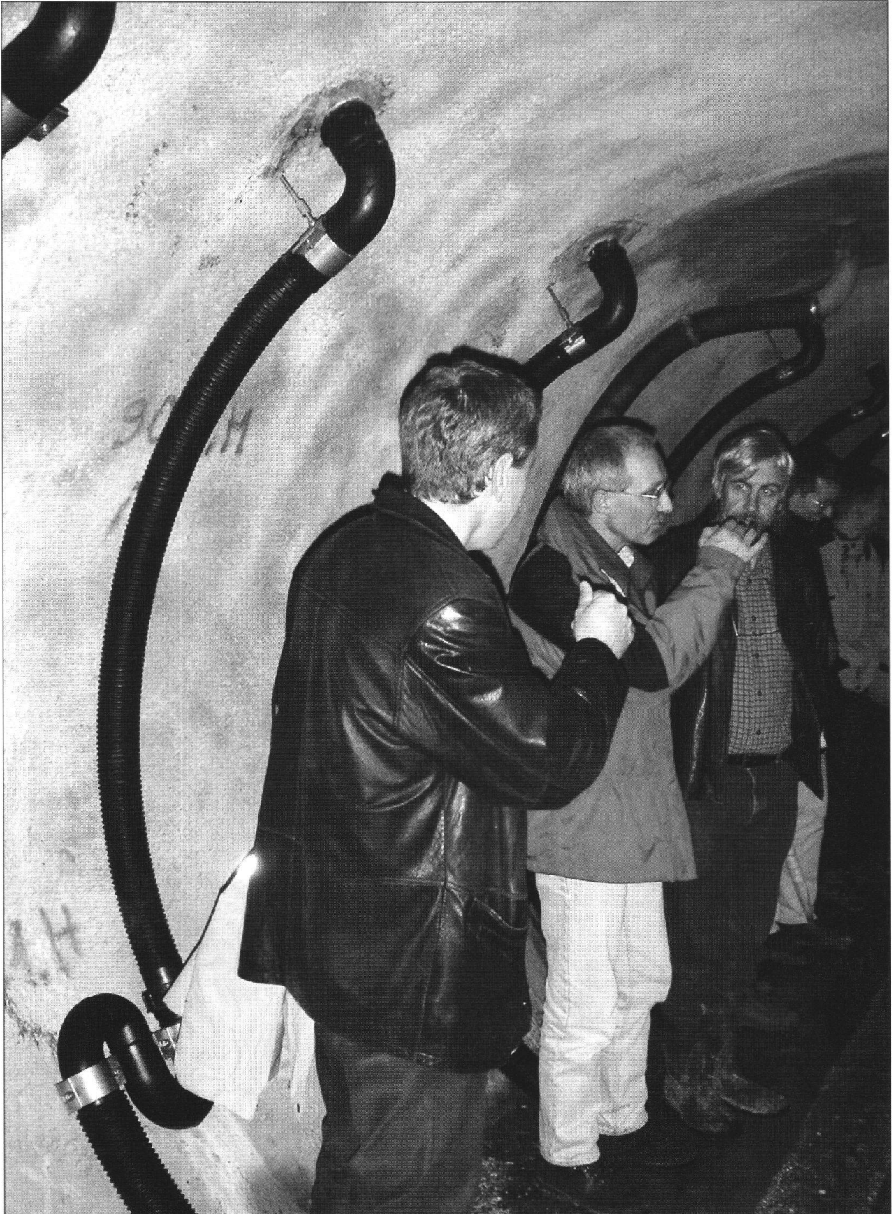
Foto 6: Angeregte Diskussion im Ischenstollen. Gut sichtbar sind die Ableitungen der steil bergwärts angeordneten Drainagebohrungen. (Foto S. Frank)