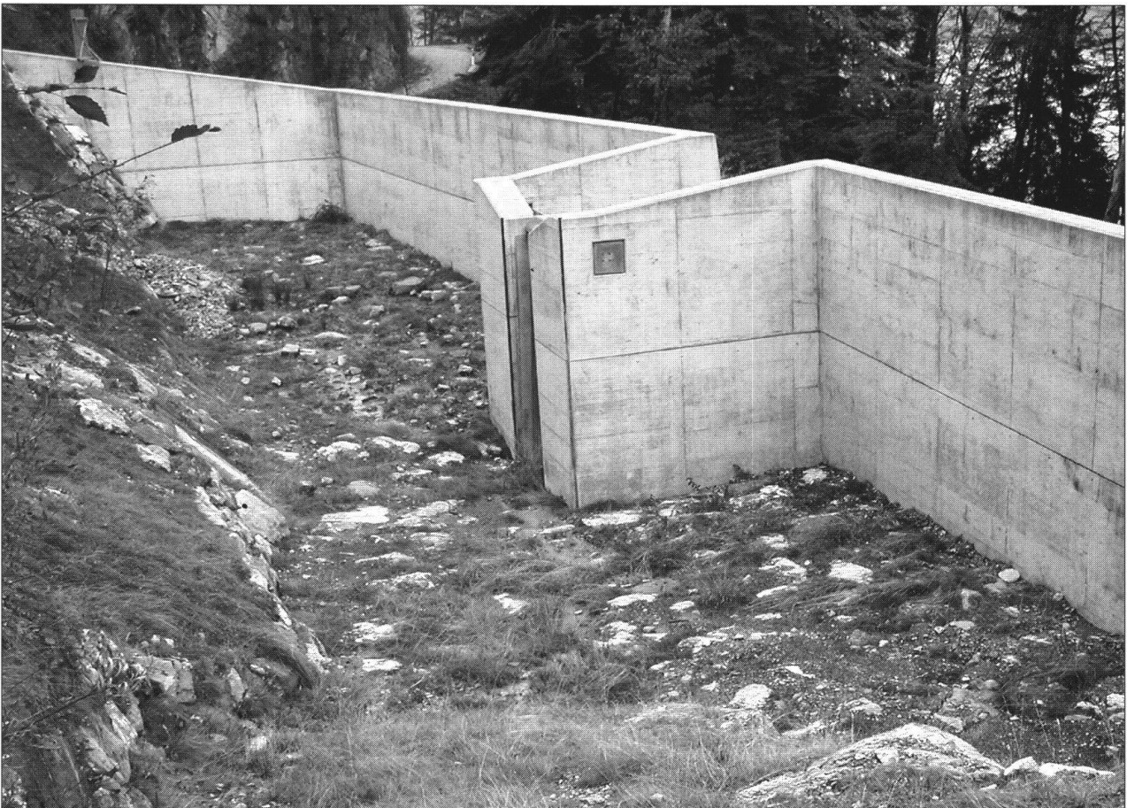
Foto 8: Rückhaltevolumen in einem der vier Geschiebesammler.