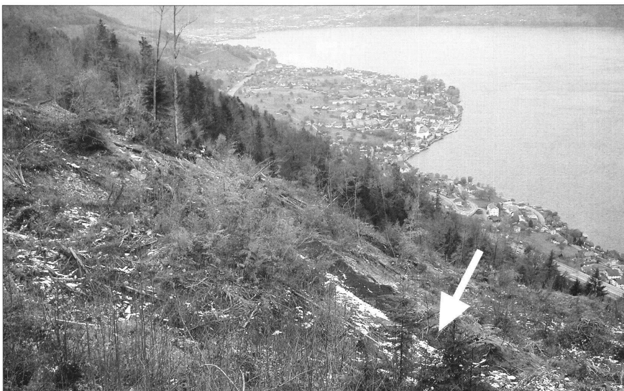
Foto 1: Tiefblick auf das Rutschgebiet Ischenwald ob dem Vierwaldstättersee. Die Lage der abgerutschten Strasse (Pfeil) zeigt das Ausmass der Differenzialbewegungen an.

Unter der Leitung von Dr. Daniel Bollinger und Reto Murer konnte zuerst das Anrissgebiet der über 2,5 Mio m 3 umfassenden Rutschung begangen werden. Dabei war auch ein eindrücklicher Tiefblick in das Transit- und Ablagerungsgebiet möglich.