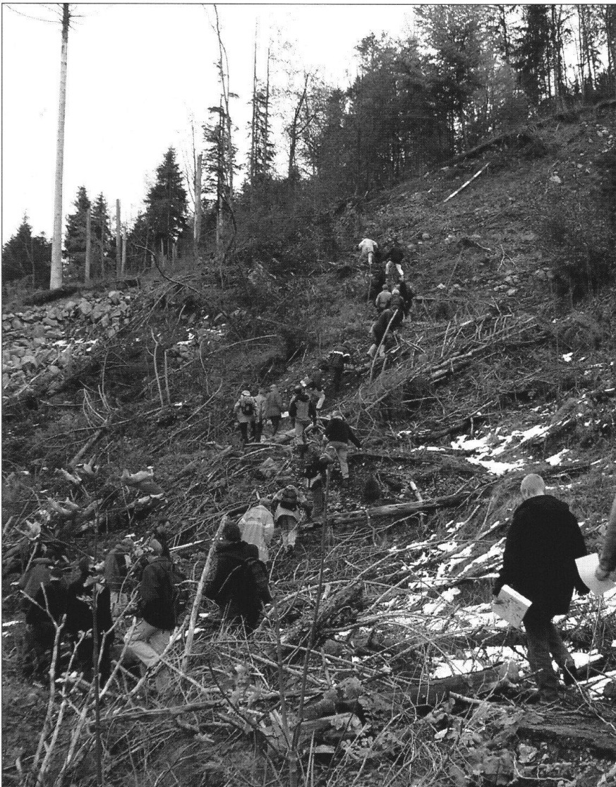
Foto 4: Beschwerliches Wandern im «Lothar»-geschädigten Rutsch- gebiet.