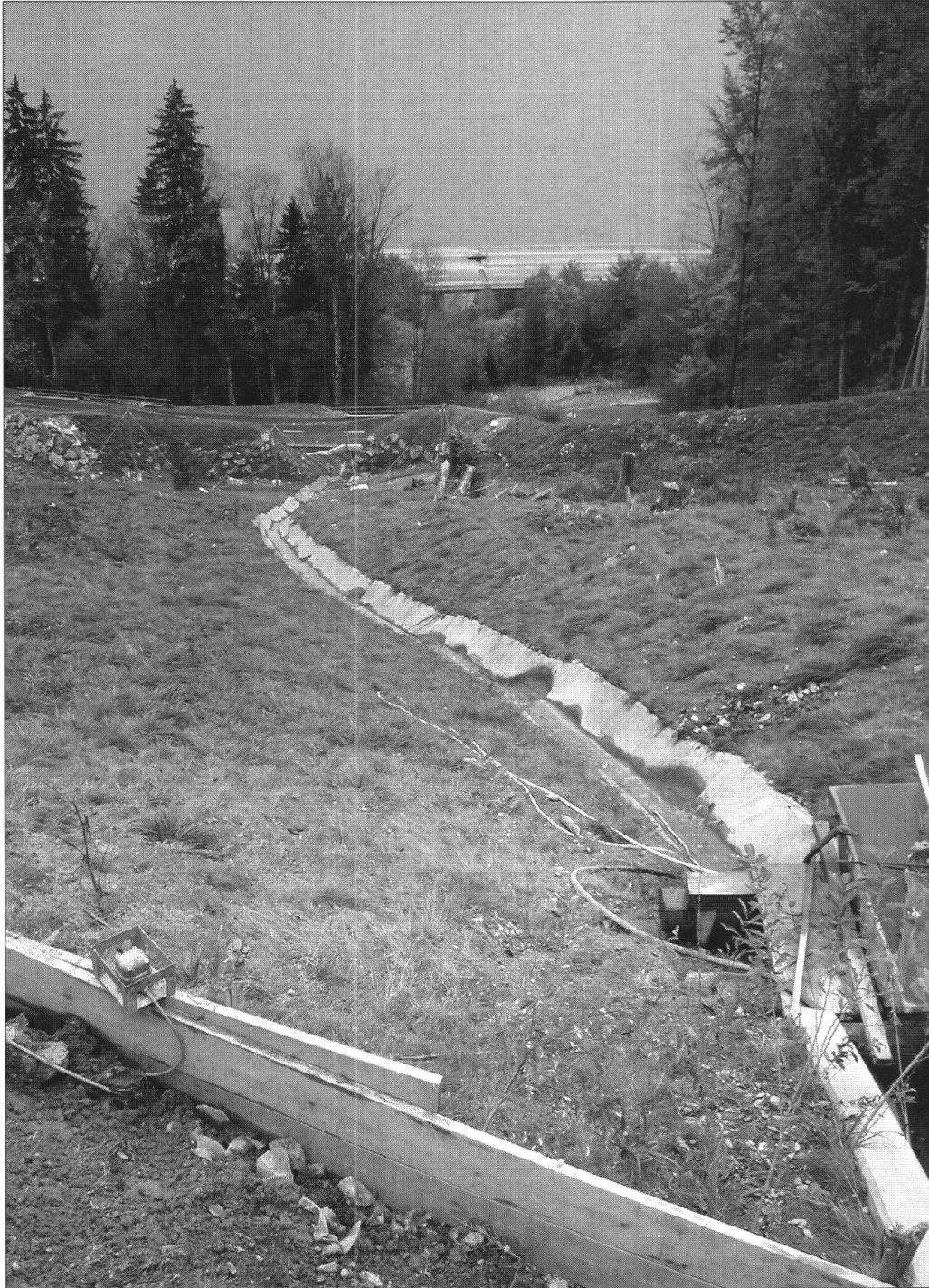
Foto 9: Eindrückliche Perspektive von einer der Sperren Richtung Kantonsstrasse und Autobahn A2.

Die in sportlichem Tempo durchgeführte, eindruckliche Exkursion regte zu intensiven Diskussionen über Prozessverständnis, Gefahreinstufung sowie Art und Dauerhaftigkeit von Sanierungsmassnahmen an.