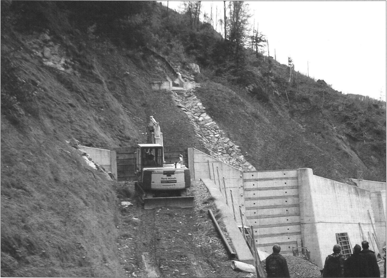
Foto 7: Gerinneverbau und Geschiebesammler in sehr steilem Gelände talseitig der Rutschmasse.