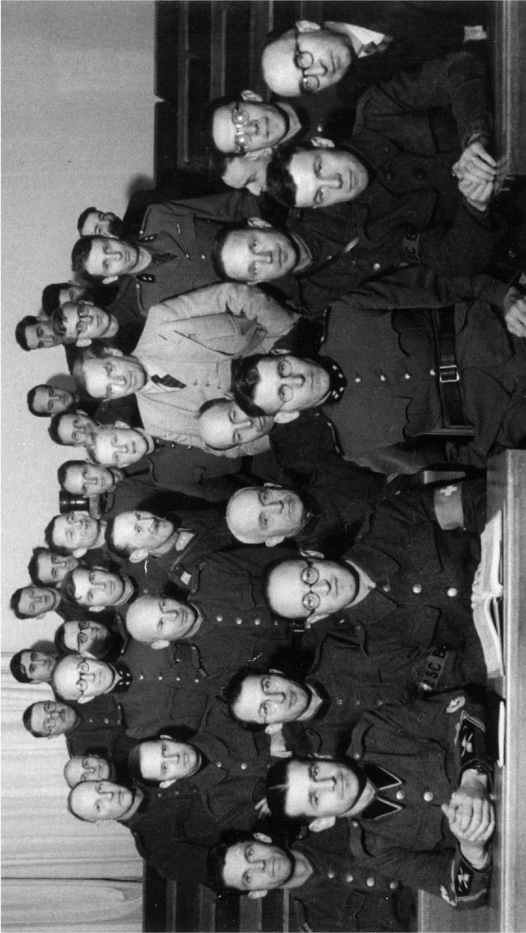
Fig. 1: Trinkwasser-Kurs des Geologischen Dienstes, Ende 1944.