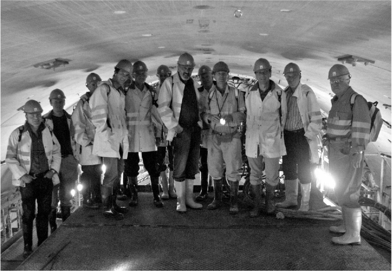
Fig. 1: Teilnehmer der SFIG-Besichtigung des Weinbergtunnels DML auf der TBM-Plattform.