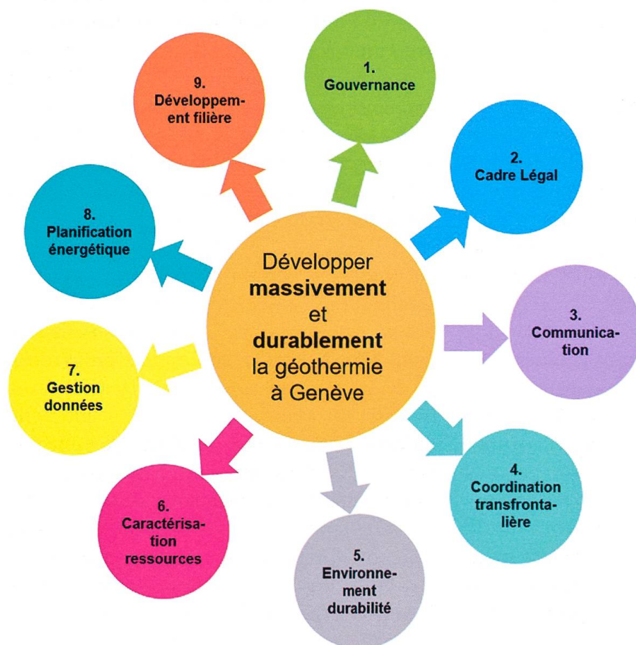
Fig. 2: Objectifs du programme GEothermie 2020 et axes de travail identifiés.

Une gouvernance commune entre l'Etat (Département du Territoire - office cantonal de l'environnement et office cantonal de l'éner-