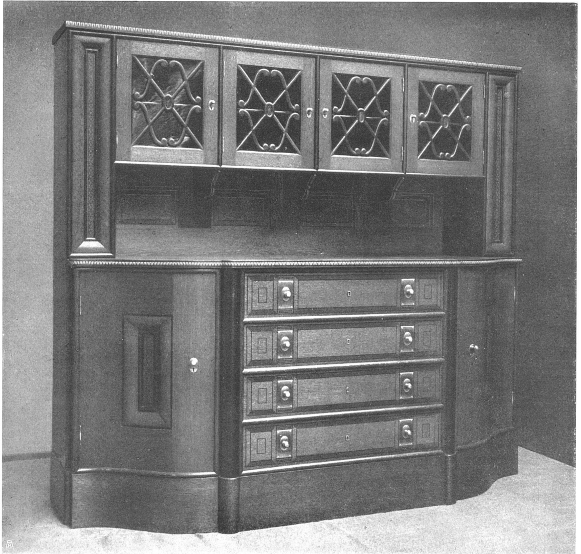
Buffet in Eichenholz, gebeizt, mit Einlagen aus Wassereiche, Zitrone und Amarantholz Beschläge Altmessing

Entworfen von Otto Ingold, Architekt B. S. A., Bern Ausgeführt von Hugo Wagner, Bern