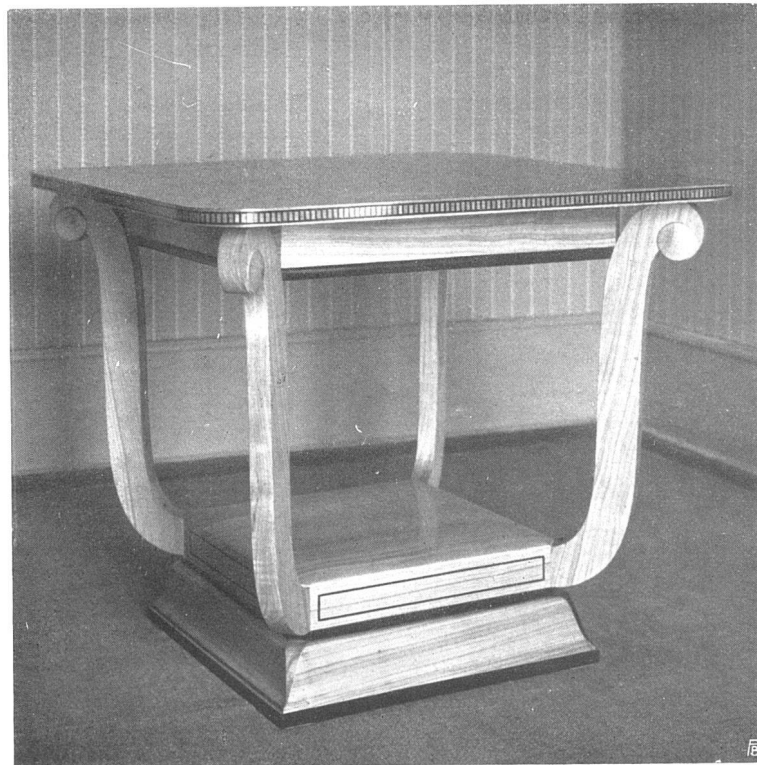
Verandatisch Kirschbaumholz matt poliert Einlagen Palisander