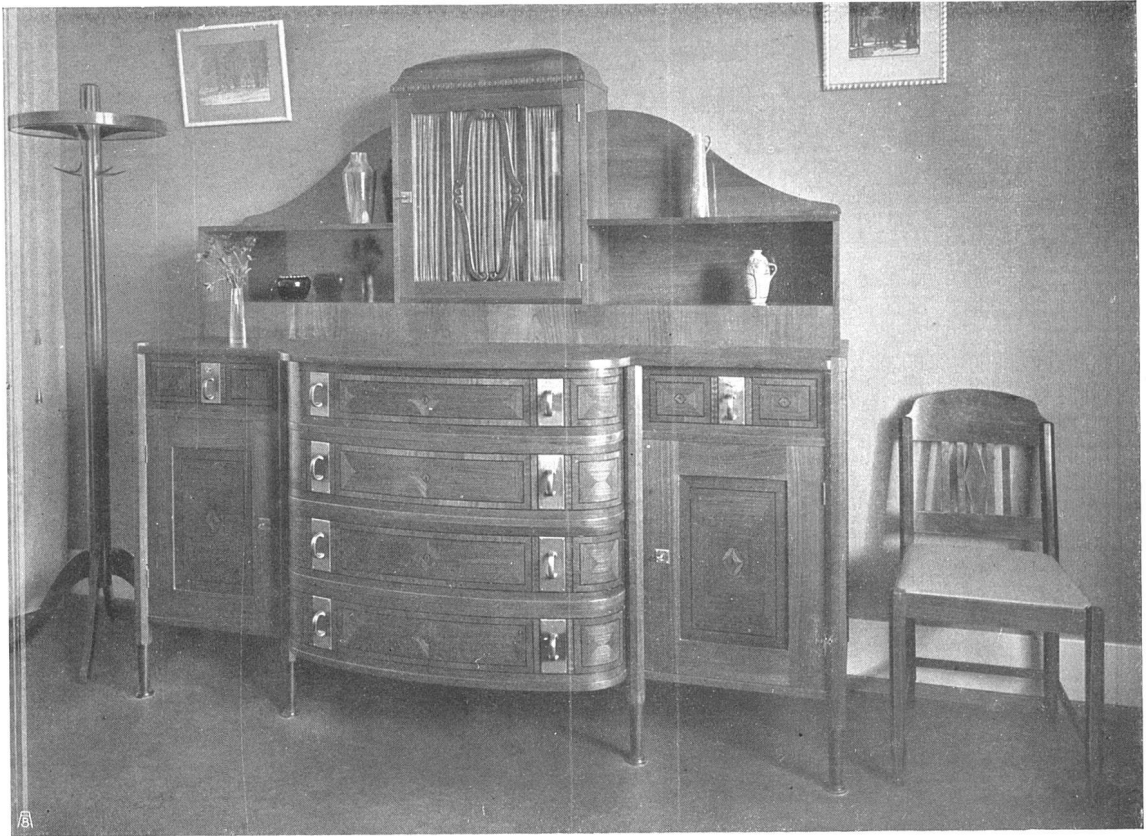
Wäschekommode in Kirschbaumholz, matt poliert mit Einlagen in Wassereiche Beschläge Messing matt