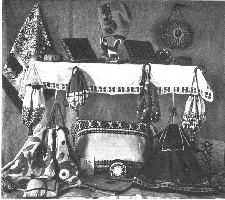
Stickereien und Handarbeiten

von vorneherein eine Absage an jegliches künstlerische Empfinden. Diese Andenkenbazarware hat uns ganze Industriezweige, wie die Töpferei und die Holzschnitzerei zugrunde gerichtet. Hier Wandel zu schaffen tat längst not, und die Vereinigung für Heimatschutz hat sich ein grosses