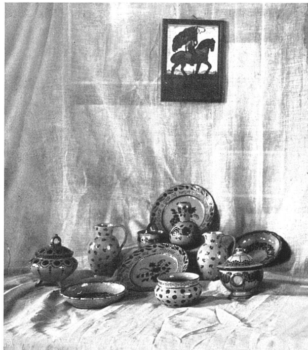
Oben: Bazar des Heimatschutzes an der Landesausstellung

des Impulses wegen, der von dieser verdankenswerten Anregung ausgehen soll. Es wird hier der Versuch gemacht, einen der schlimmsten Nebentriebe unserer einheimischen Industrien in sehr erfreuliche Bahnen zu lenken. Was im allgemeinen als Fremdenartikel feilgeboten wird, ist