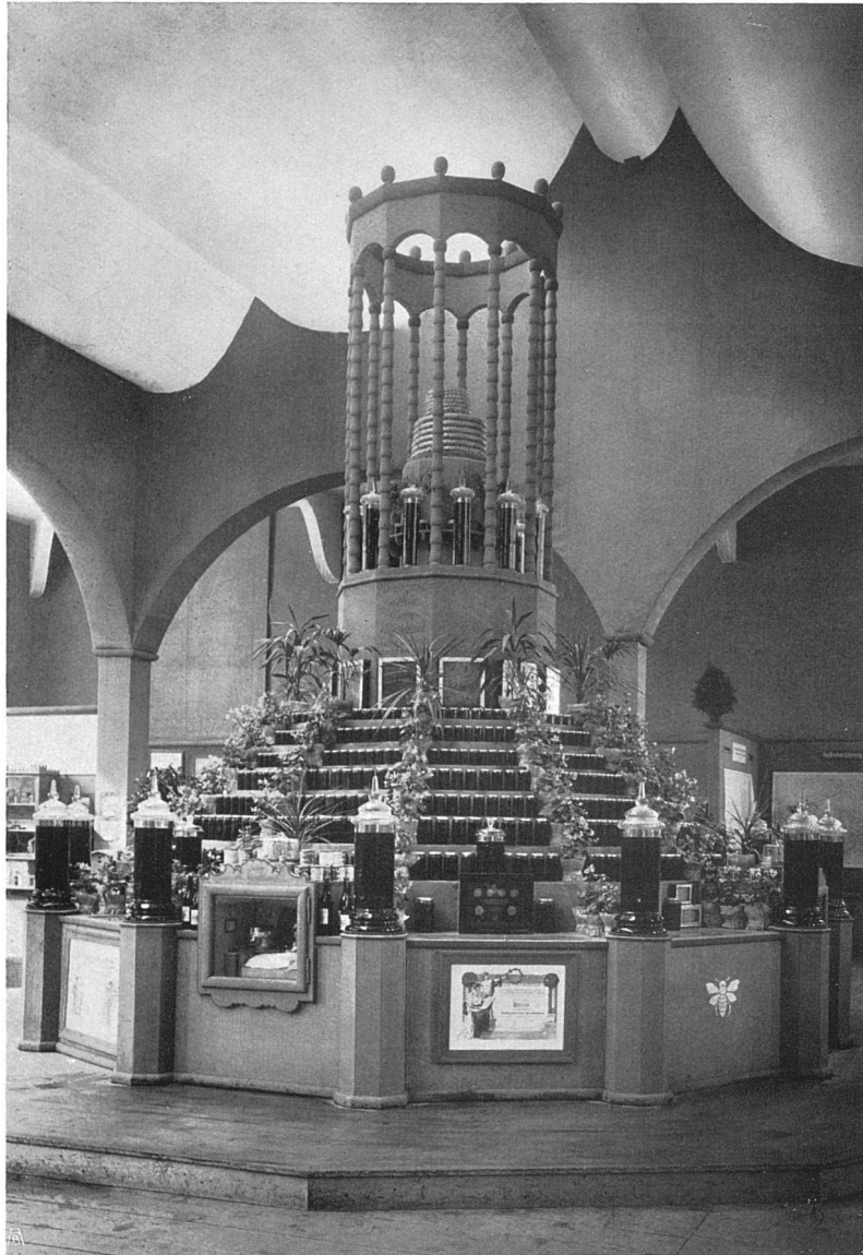
Ausstellung der Bienenzüchter Bern-Mittelland

Joss & Klauser, Arch. B. S. A., Bern