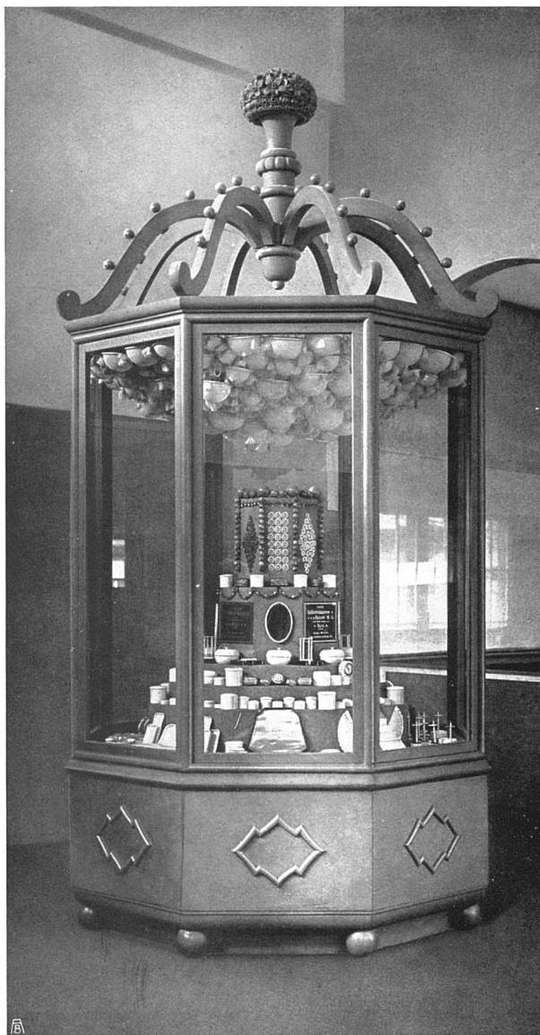
Ausstellung der Celluloidwarenfabrik Käser & Moilliet Schönbühl