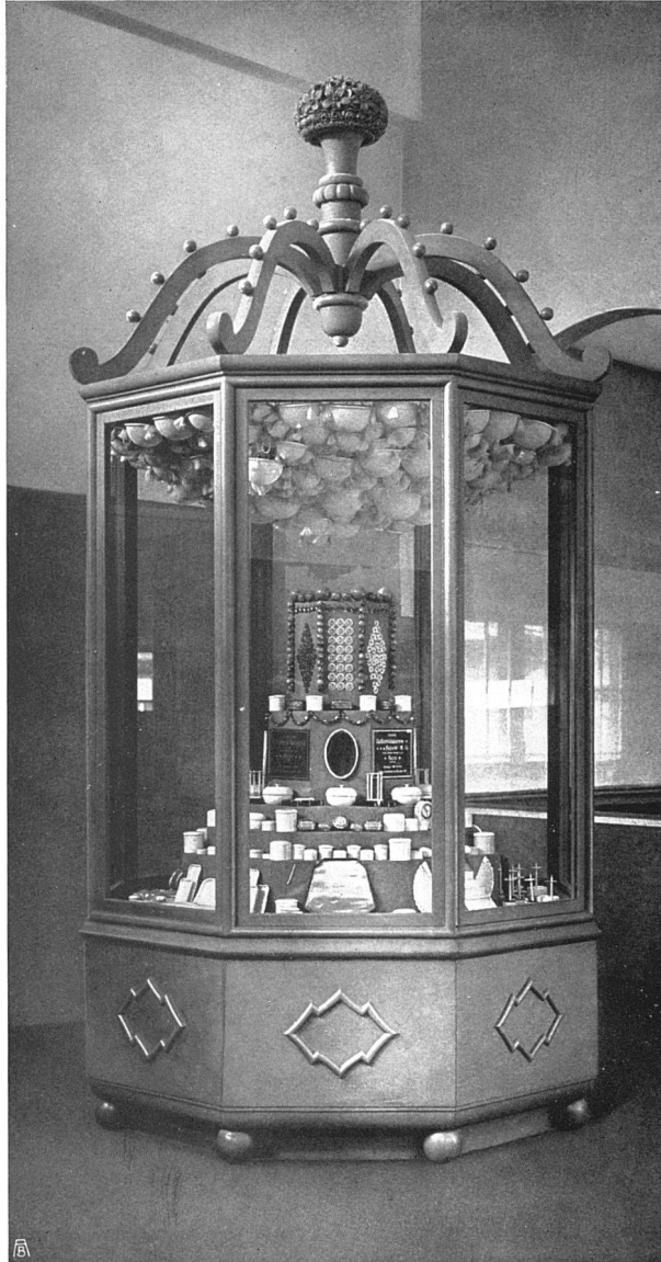
Ausstellung der Celluloidwarenfabrik Käser & Moilliet Schönbühl