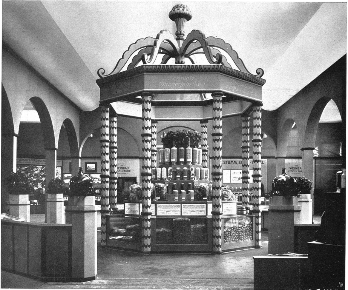
Ausstellung der Schweiz. Düngefabriken

Joss & Klausner, Arch. B. S. A., Bern