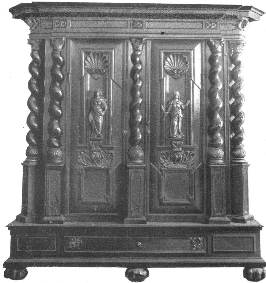
Barockschrank. Schwarz poliert. Frauenfiguren und einige Akanthusornamente vergoldet. Schloss und Flachränder graviert. Um 1700—1720. Höhe 130 cm, Breite 205 cm, Tiefe 76 cm. Auktion Helbing, München.