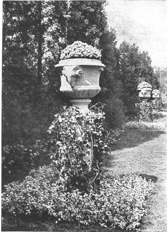
OTTO FROEBEL'S ERBEN / ZÜRICH 7 PROJEKTIERUNG UND AUSFÜHRUNG VON GARTEN- UND PARK-ANLAGEN