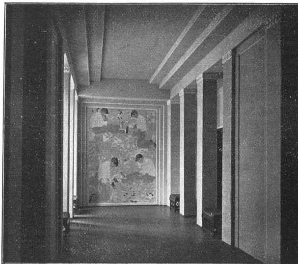
VORHALLE IN ETERNIT