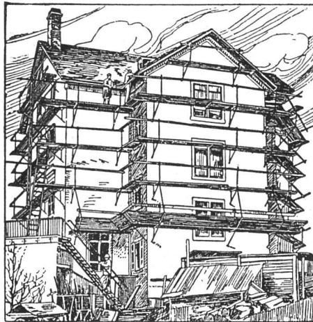
Ganz eingerüstetes Haus

Keine Gerüststangen, daher einfachstes Gerüstverfahren und bedeutende Ersparnis