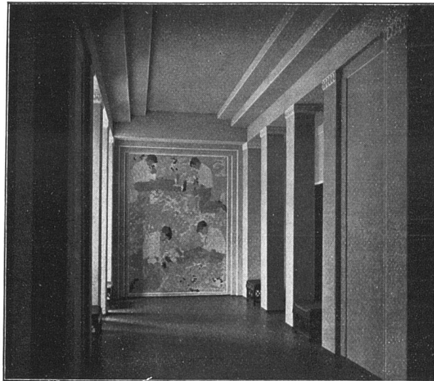
VORHALLE IN ETERNIT