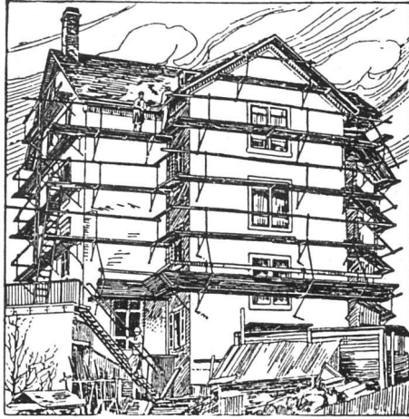
Ganz eingerüstetes Haus

Keine Gerüststangen, daher einfachstes Gerüstverfahren und bedeutende Ersparnis