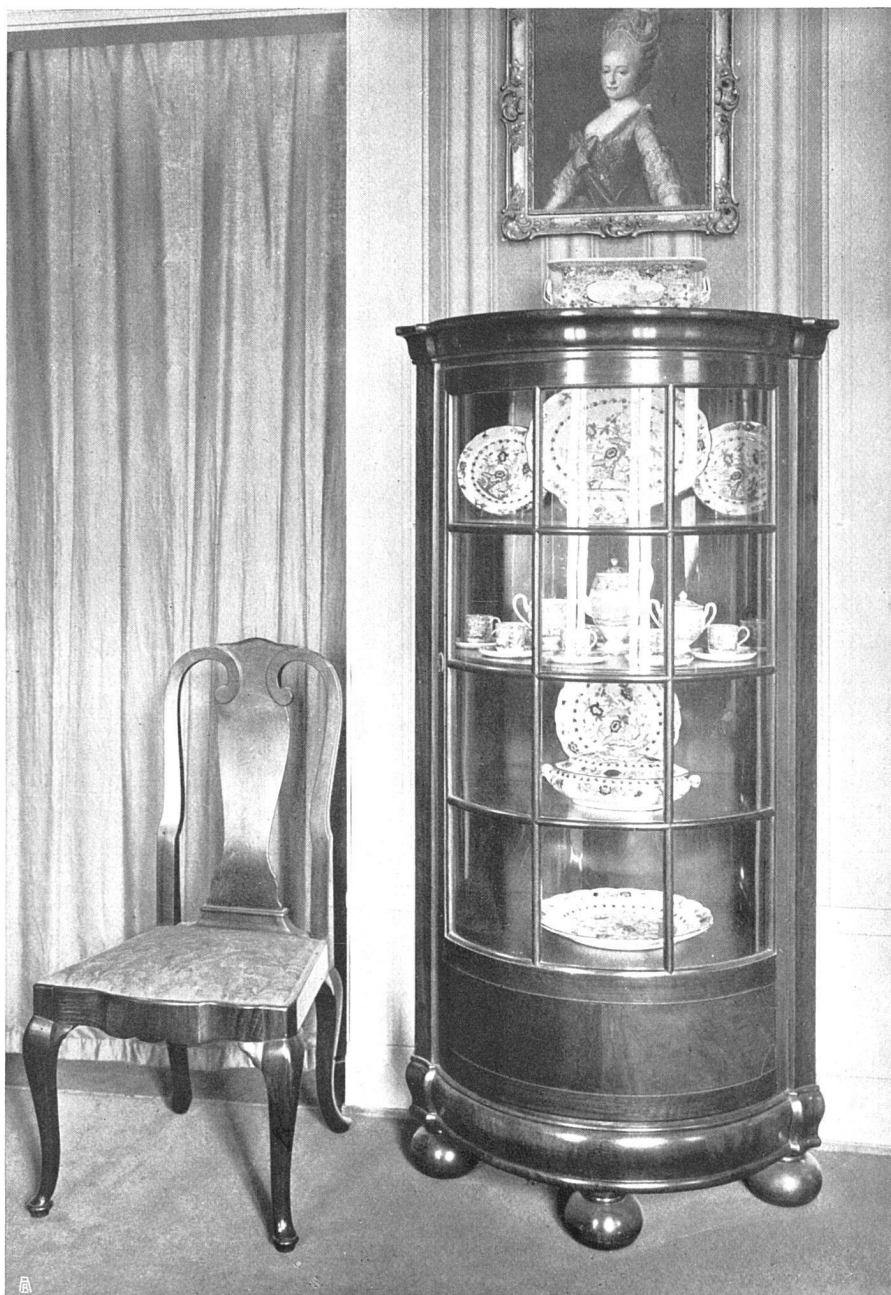
Zierschrank und Stuhl aus demselben Zimmer.

ähnliche Probleme folgen ihnen auf ihren verschiedenen, beinahe entgegengesetzten Wegen. Man sehe sich darauf hin die vielen gleichartigen Motive an, in denen Buchser das in Rot, Weiß und Blau gekleidete Mädchen farbig gestaltet.