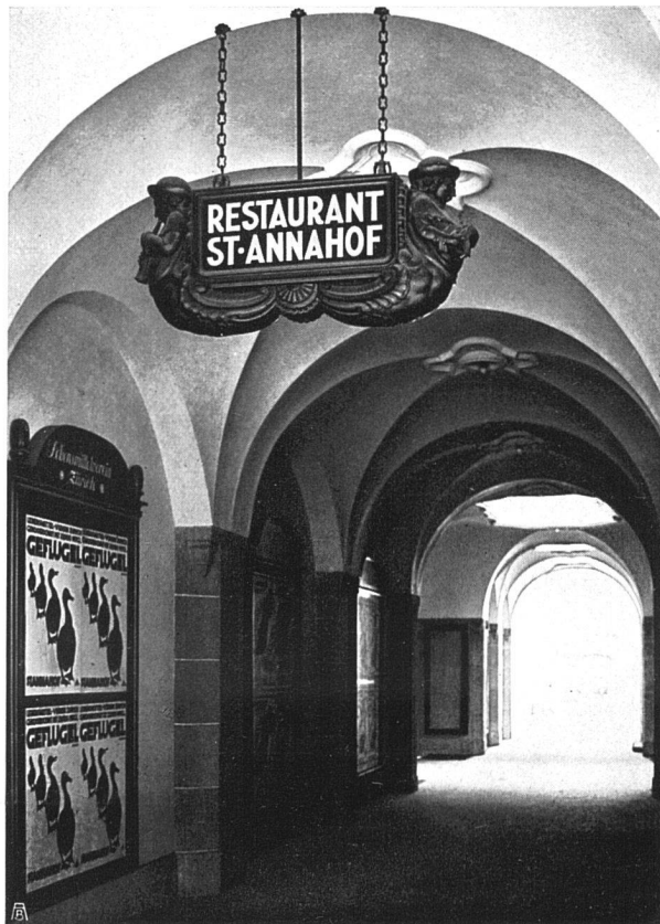
St. Annahof, Zürich Lebensmittelhalle u. Eingang zum Hof