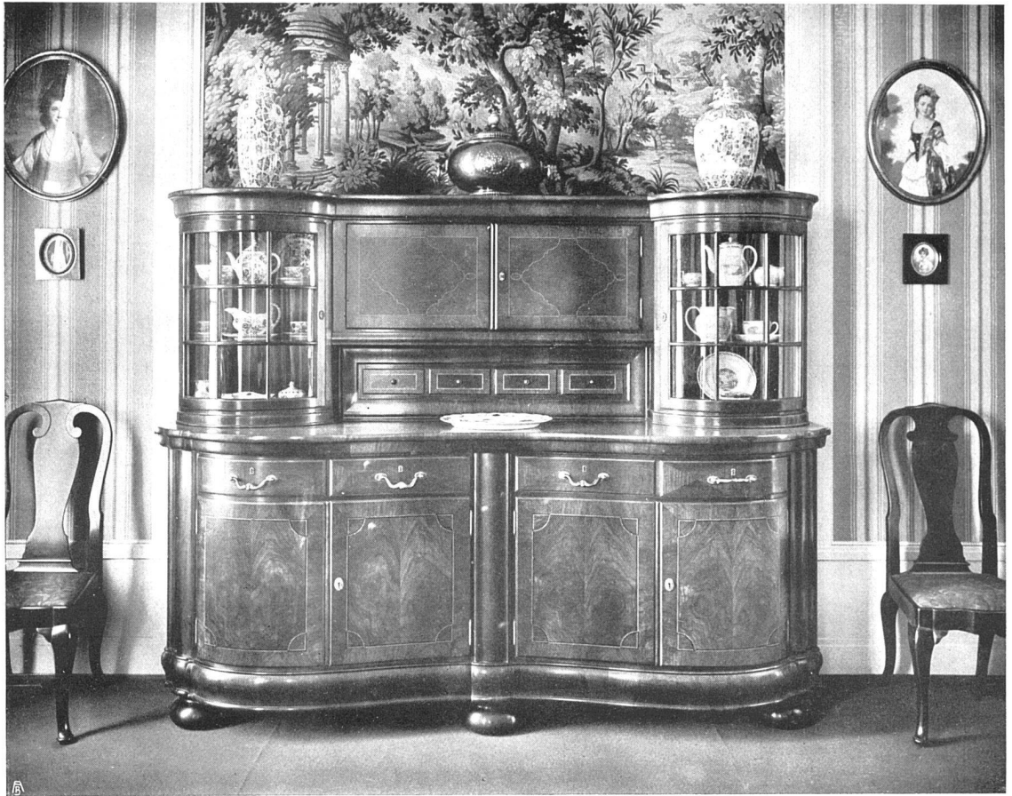
Buffet aus demselben Zimmer.

Seitedarstellend, von einer farbigen Finesse, die man eine Erfindung neuester Zeit glaubt; dazu gehört die Skizze zu dem oben erwähnten Porträt der Mrs. S. und das Bild einer vornehmen englischen Reiterin. Dazu rechnen wir vor allem die prachtvollen Landschaftsskizzen: die Gewitterstimmung am Vierwaldstättersee aus Basler Privatbesitz (1855), die spanische Küste mit dem weiten Blick in das ebene Land, unter der wir erst einen Blick gegen Terracina vermuteten, das marokkanische Strandbild, die Schweizer Landschaft von 1860 und die Küste bei Scarborough von 1856. Dann die figürlichen Skizzen, in denen er auch viel freier und eigenartiger erscheint als in den ausgeführten Kompositionen. Da sind vor allem das Mädchen auf Corfu von 1884, das Frühstück am Waldrand (1863), das italienische Hirten-