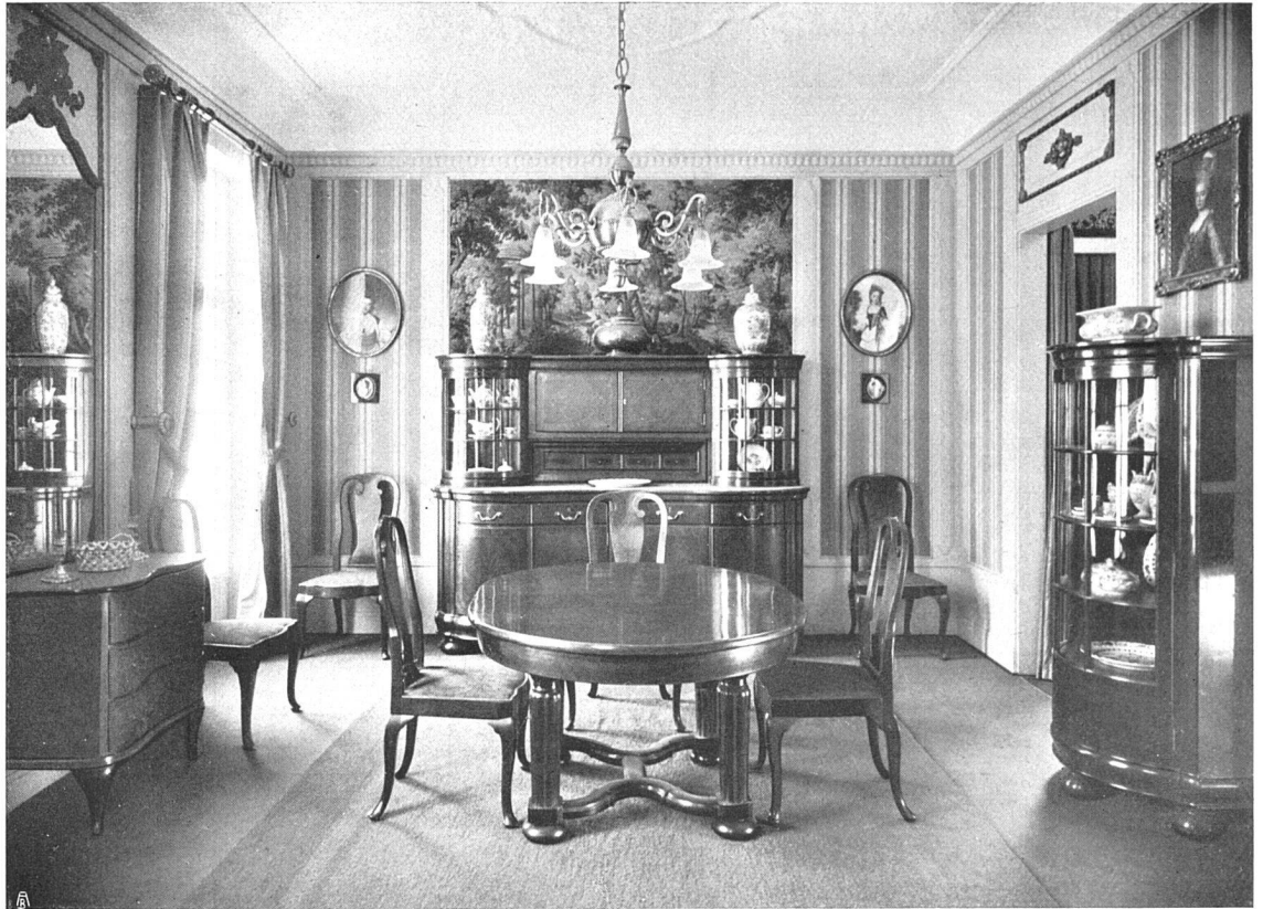
Raumkunst an der Schweizerischen Landesausstellung. Fränkel & Völlmy, Basel. Speisezimmer in barocken Linien in maserigem Nußbaumholz poliert. Holz in altgoldton gestimmt.

Bildern am klarsten zum Ausdruck, die Buchsers in seinen Skizzen. Die fertigen Bilder Buchsers haben fast alle etwas Zeitliches an sich, im Wollen verblüffend neu und revolutionär, drückt ihnen die Durcharbeitung den Stempel ihrer Zeit auf. In den Skizzen bleibt nur der leidenschaftliche Ringer mit neuen Problemen, die er all den spätern Schulen vorweg nimmt und mit genialer Unbefangenheit be- meistert. Buchser läßt sich von den widersprechendsten Vorbildern zur eigenen Produktion anregen, und fast jede dieser Nacheiferungen läßt an einen andern spätern Meister denken, der diese Art des Schauens und Schaffens bis zum Typischen durcharbeitete; während sie bei Buchser nur wie zufällig anklingt und deshalb nicht die nachhaltige Wirkung ausüben konnte. Deshalb auch steht das Kunstschaffen Buchsers so neben aller Entwicklung in