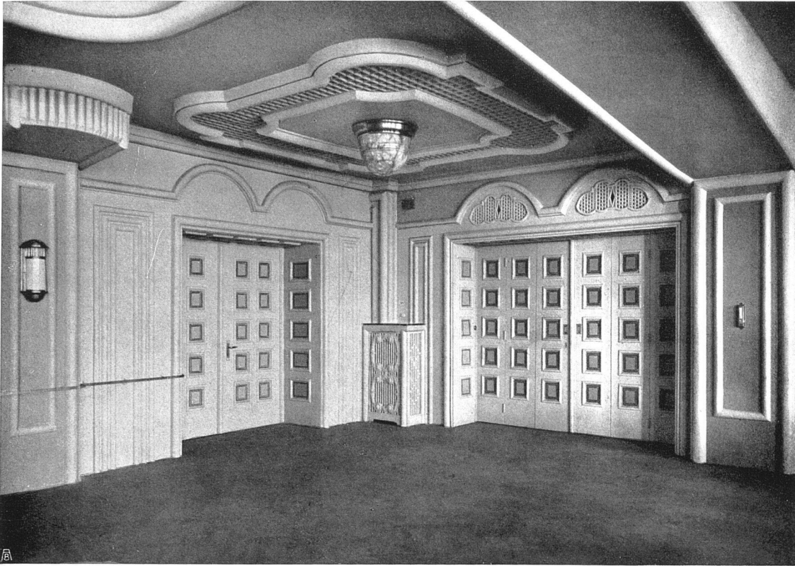
Volkshaus Bern. Arch. B. S. A. Otto Ingold, Bern. Ecke im großen Saal. Gips- und Malerarbeiten: Gips- und Malergenossenschaft Bern. Schreinerarbeiten: Fritz Wyler, Bern