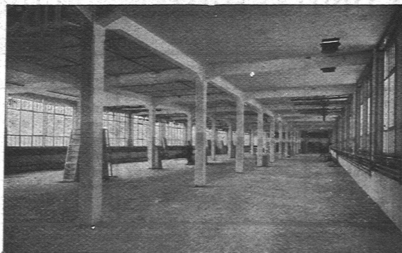
NEUE FABRIKANLAGE C.F. BALLY A.-G., SCHÖNENWERD 12000 m 2

Spring, Burger & Cie., Kaminhutfabrik, Basel