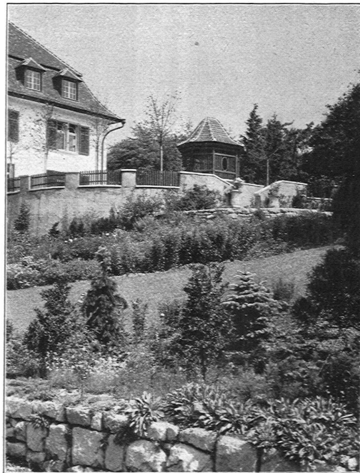
Der Übergang von der Hausterrasse zum Garten

OTTO FRÖBEL'S ERBEN Gartenarchitekten Zürich 7