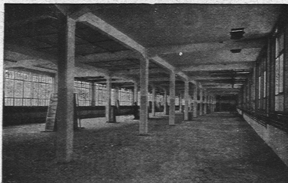
NEUE FABRIKANLAGE C.F. BALLYA.-G., SCHÖNENWERD 12000 m 2

Spring, Burger & Cie., Kaminhutfabrik, Basel