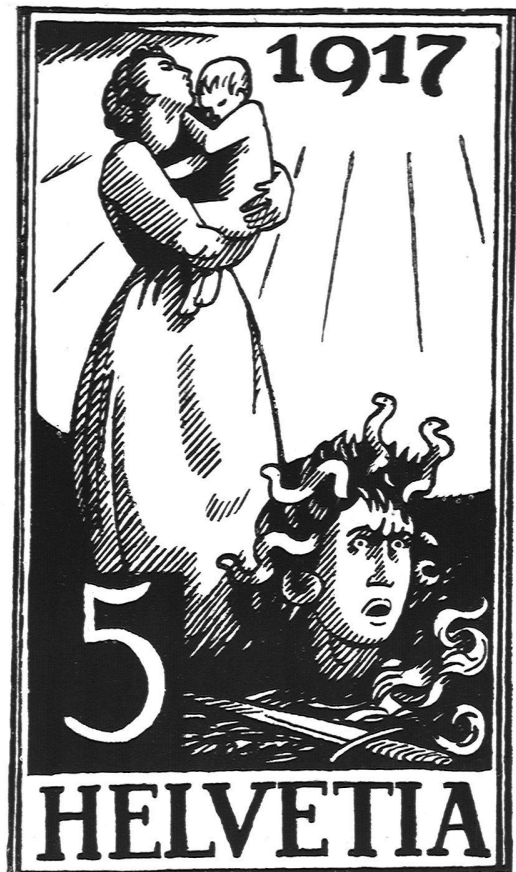
Motto: „Medusa“, Emil Cardinaux, Muri bei Bern

werden und hat seine finanziellen Folgen. Er wird entkräftigt mit der Aussicht, daß in weitem ähnlichen Einladungen wiederum andere Kräfte herbeigezogen werden können. Mit der Ausschreibung war eine innerlich wahr empfundene Darstellung verlangt, die als Erinnerungszeichen auch später an den Ernst unserer Zeiten gemahnen soll. Die Aufgabe war sehr schwer. Unter den eingelangten Entwürfen zeigen etliche das Bemühen, wenn auch ein bekanntes Symbol, in der Friedenstaube, im Friedensengel, doch eine neuartige Fassung zu geben und diese graphisch einfach durchzuführen. Die Seite mit den Abbildungen in der Ausführungsgröße gibt über die Wirkung in der Verkleinerung interessanten Aufschluß. In den Darstellungen von O. Baumberger, Edouard Vallet und E. Cardinaux