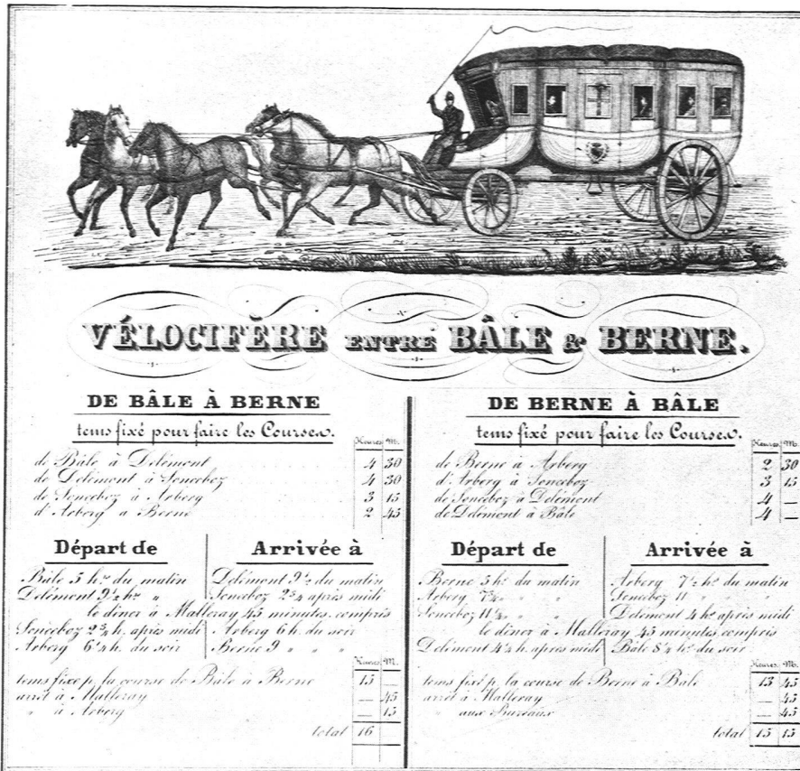
Fahrplan der Postverbindung Bern-Basei