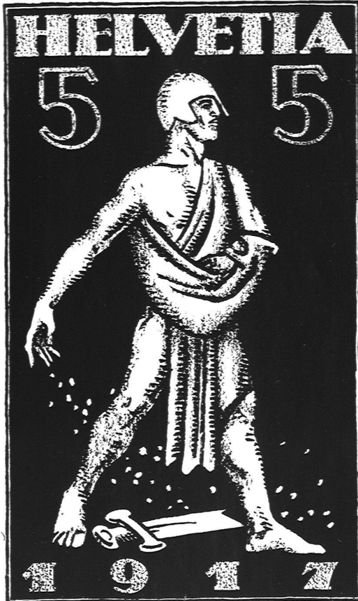
Motto: „Saat“, Otto Baumberger, Zürich