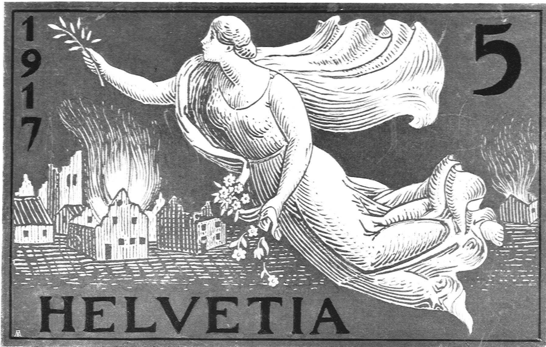
II. Preis, Motto: „Helvetia“