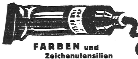
FARBEN und Zeichenutensilien

Gesichtspunkte, unter denen er die Kunstgeschichte betrachtete, auch den Mitarbeitern nahe zu legen. So erschöpft sich dieses Handbuch nicht, wie bisher üblich, in trockener äußerlicher Systematik und statistischer Aufzählung, die ja sicher auch ihre Berechtigung haben für die wissenschaftliche Betrachtung und Verwertung der Kunstschatze. Fritz Burger war es um eine neue Systematik zu tun, die aus den stilbildenden Elementen des künstlerischen Schaffens hervorgeht. Nicht bloß eine chronologische Ordnung nach Schulen und äußerlichen Einflüssen, sondern eine zusammenfassende Betrachtung großer Künstlerrepubliken, die von einem gemeinsamen Formwillen getragen sind. Unter Betonung der nationalen Eigenart soll mit dem bisher alleingültigen geschichtlichen der künstlerisch formale Standpunkt vereinigt werden. Die bisher erschienenen Lieferungen, die schon die verschiedensten Gebiete berücksichtigen, sind denn auch nicht bloß ein Dokument deutschen Gelehrtenfleißes, sondern eine lebendige Quelle künstlerischer Erkenntnis, die sich nicht