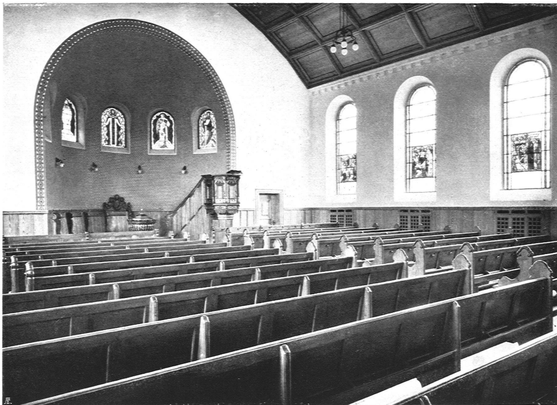
Inneres der Kirche. Blick zum Chor hin. Kirchenbestuhlung erstellt von der Rolladenfabrik A. Griesser A.-G., Aadorf

faßt sind. Auch sie sind in der Zeichnung sorgfältig vorbedacht für eine Ausführung in Glas. Diese hat Glasmaler O. Lieberherr in Frauenfeld besorgt. Die Wappenscheiben bilden, je zu zweit angeordnet, einen wohlgelungenen Schmuck der Kirche. Mit diesen Fenstern ist die Anregung vermittelt, daß auch weitere Kirchgemeinden, nicht