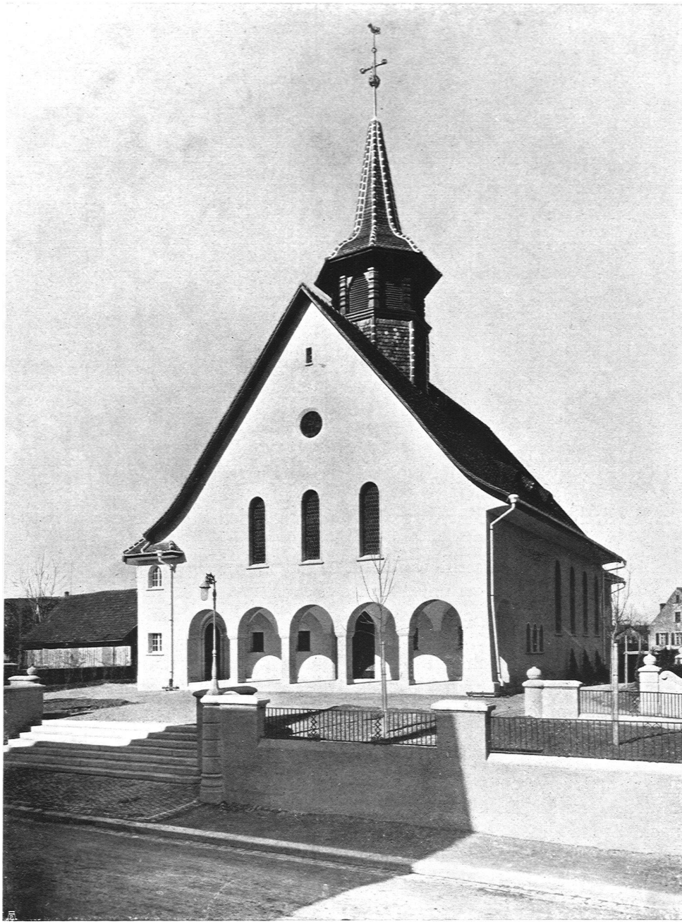
Brenner & Stutz, Architekten B. S. A., Frauenfeld