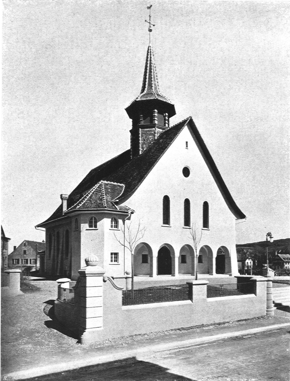
Brenner & Stutz, Arch. B. S. A., Frauenfeld. Kirche zu Kurzdorf. Umgebungsarbeiten (Anlage der Wege) erstellt von der Schweiz. Straßenbau-Unternehmung A.-G., Bern, Zürich, Lausanne

und in großen Zügen durchgebildet, und dabei sind sie in ihrer Haltung, in der Bestimmung ihrer Farbe zur Linken und Rechten der Christusgestalt wie architektonische Glieder eingeordnet. Wie Linck in seinen Scheiben kräftig wirkt, niemals süßlich, wie er das ornamentale Beiwerk unterordnet, den Grund in pati-