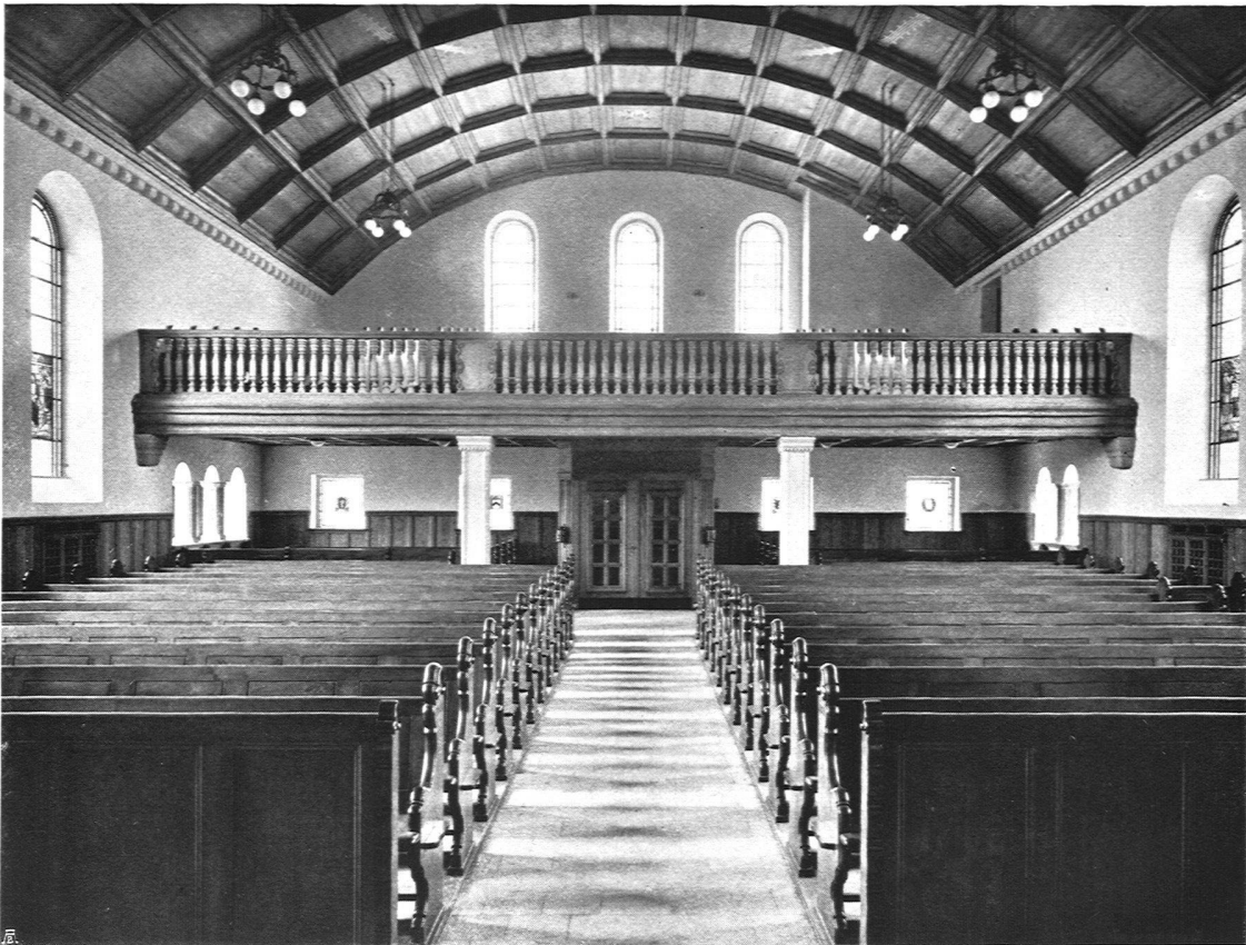
Inneres der Kirche