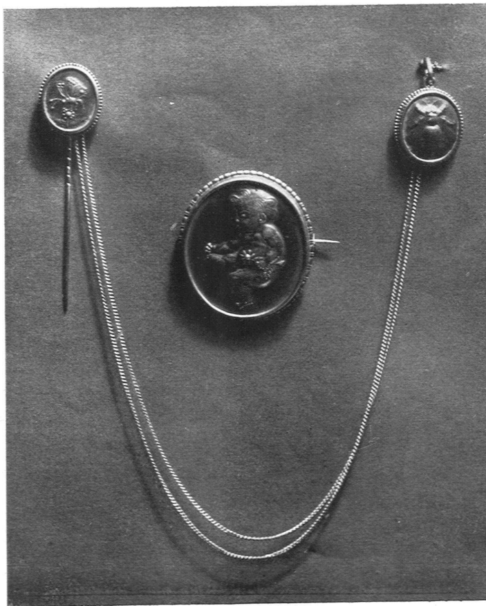
Spitteler-Medaille: Aug. Heer Bildhauer S. W. B. Arlesheim