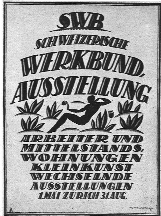
Ankauf. Maler Eduard Renggli S.W.B., Luzern Schwarz, grün und braunrot auf hellem Grund

für eine bestimmte Abteilung der wechselnden Ausstellungen eingedruckt werden können. Gut lesbare Schrift.“