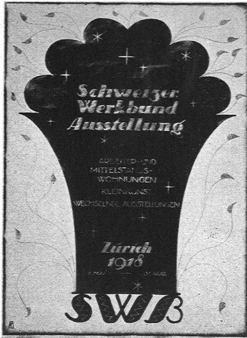
III. Preis. Architekt Paul Hosch S.W.B., Basel Schwarz mit Gold auf weißem Grund