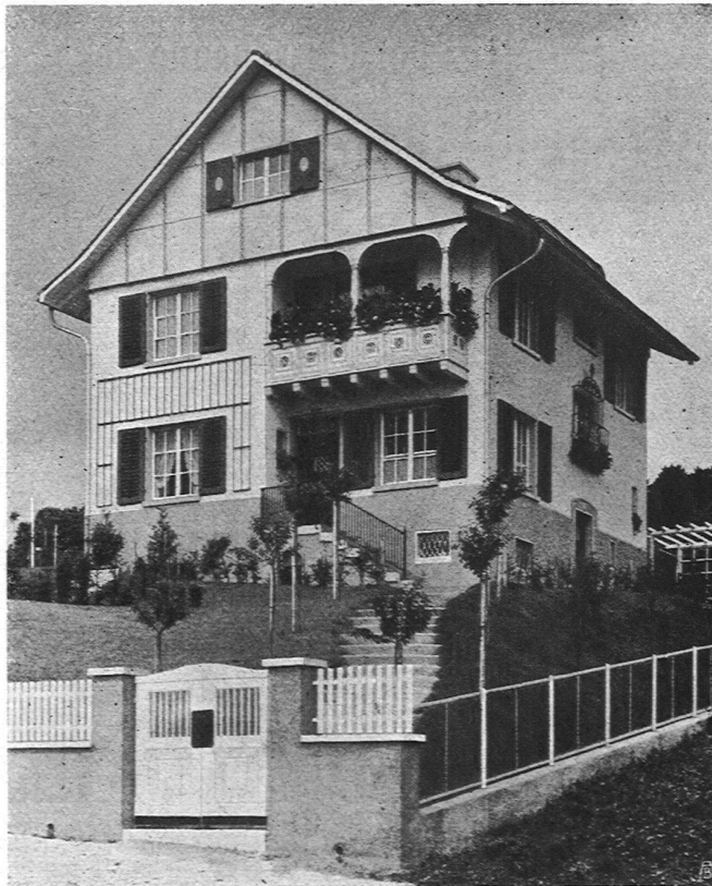
Haus mit Giebel- verkleidung aus Eternit

Bestbewährte Systeme, moderne Einrichtungen Gegr. 1862 / Goldene Medaille S.L.A.B. 1914 / Gegr. 1862