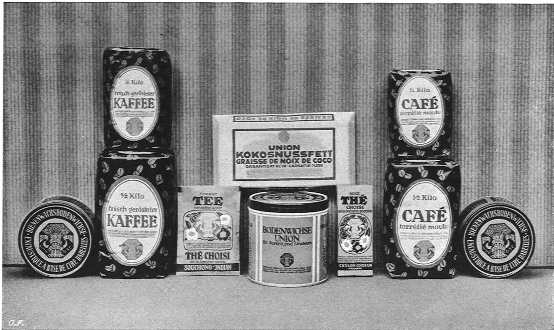
Eigenpackungen für den Verband schweiz. Konsumvereine V. S. K. Basel, Entwürfe von Paul Kammüller, Maler u. Graphiker S. W. B., Basel. Verwendung der Hausmarke, entworfen von Burkhard Mangold, Maler und Graphiker S. W. B., Basel.

tonswappen und im bürokratisch langweilig normierten Schweizerkreuz.