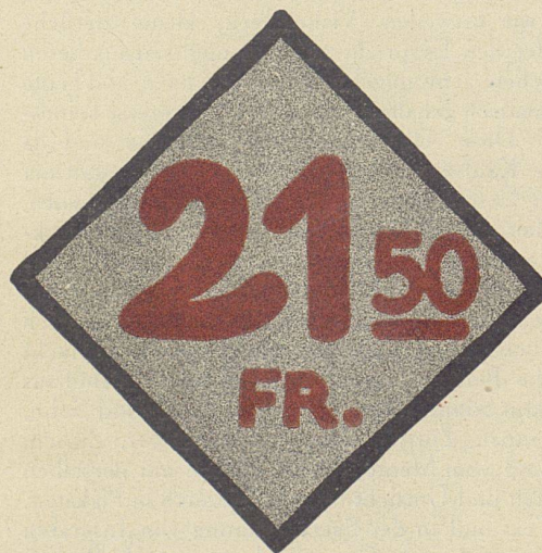
Aus dem Schaufenster-Kurs der Gewerbe-Schule Zürich. Übungen im Schriftensreiben, Anfertigen von Preiszetteln und Innenplakaten zum Aufstellen im Schaufenster. Lehrer J. Kohlmann S. W. B., Zürich.