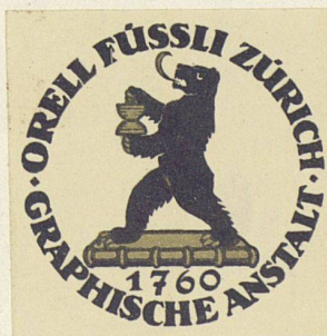
Siegelmarke, schwarz und gold

Und da jede Hausmarke ein Stück gute Heraldik ist, lebendige Heraldik in Nutzformen, müßten unsere Kaufleute aus schönem Berufsstolz schon, den