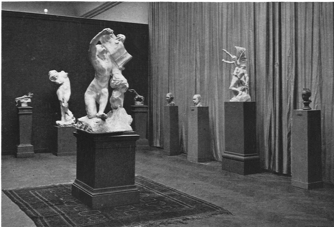
Aus der Rodin-Ausstellung in Basel