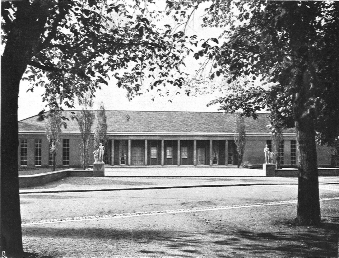
Schweizer. Werkbund-Ausstellung Zürich 1918. Haupteingang. Architekt A. Altherr S. W. B., Zürich Flastiken von Bildhauer R. Suter, Basel-Zürich