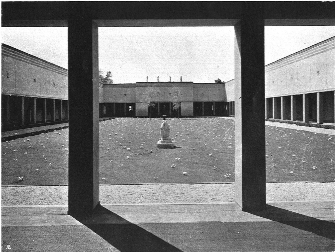
Innenhof der Ausstellung, Architekt A. Altherr S. W. B., Zürich. Plastik von Bildhauer J. Gisler, Zürich

des Schweizerischen Werkbundes, haben im jetzigen wie im zukünftigen Museum keinen Platz. Damit ist auch die äußere Trennung von Kunstgewerbe und Gewerbe deutlich erkennbar: auf der einen Seite Ausstellungen von hochqualifizierten Einzelgegenständen, verbunden mit vergleichenden und belehrenden Betrachtungen über die Herstellungsart des Objektes, auf der andern Seite die Erzeugung und Vorführung des Massen-Artikels in geschmacklich guter Durchführung. Die letztere Art dient kommerziellen Zwecken; diese sind mit den erzieherischen, rein künstlerischen Aufgaben eines neuen Museums nicht vereinbar.