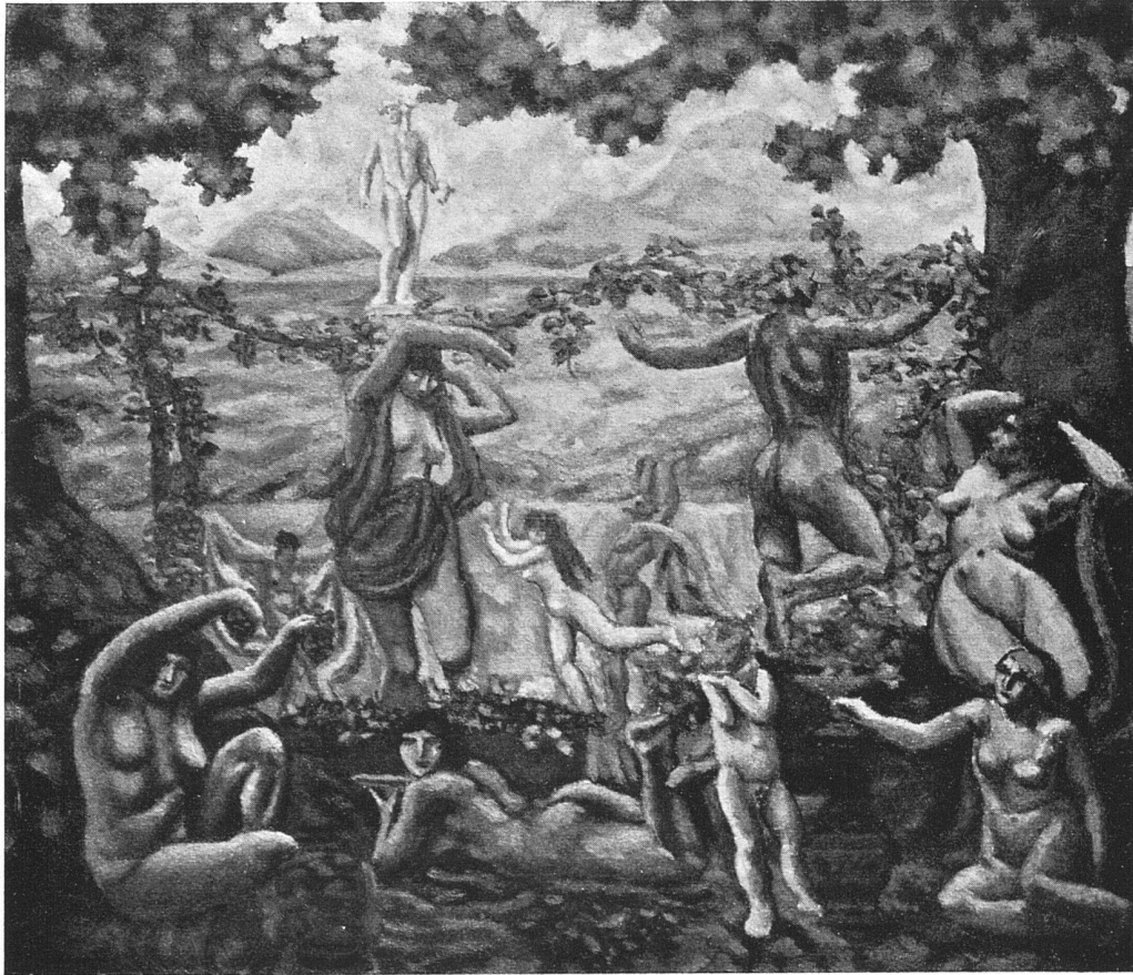
Georges de Traz, Genève