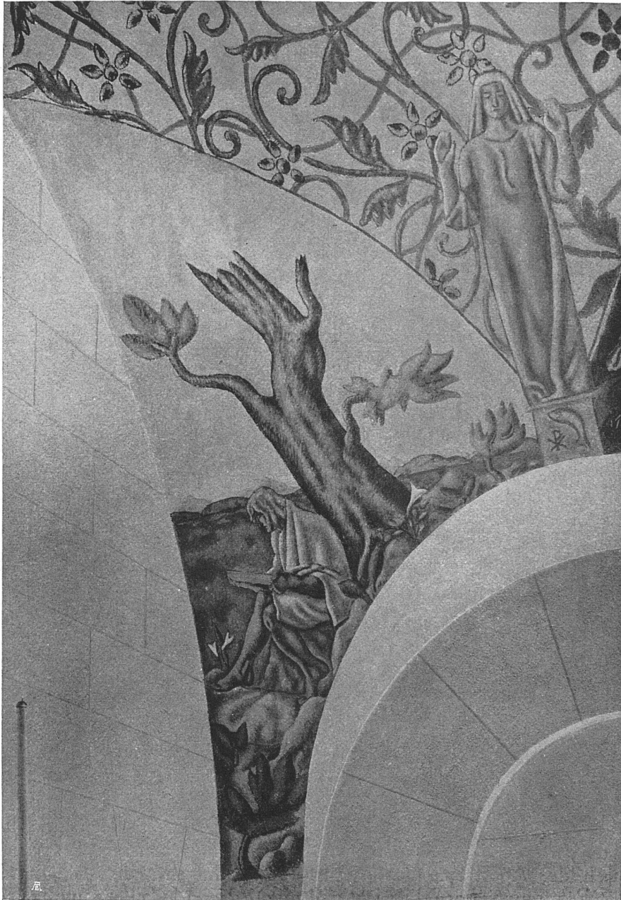
Georges de Traz, Genève