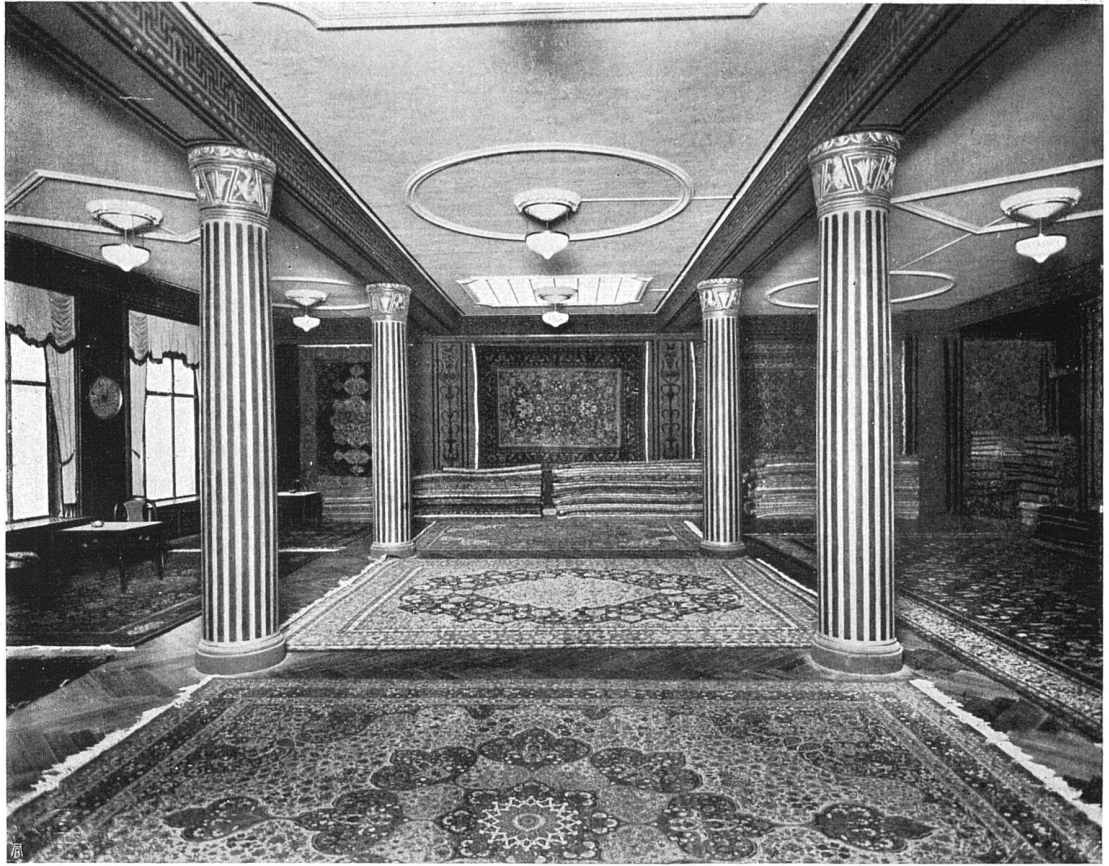
Interieurs aus den Geschäftsräumen der Forster, Altorfer & Cie., Teppichhaus, Zürich Orientsaal, Entwurf für den Umbau: Gebr. Pfister, Architekten B. S. A., Zürich