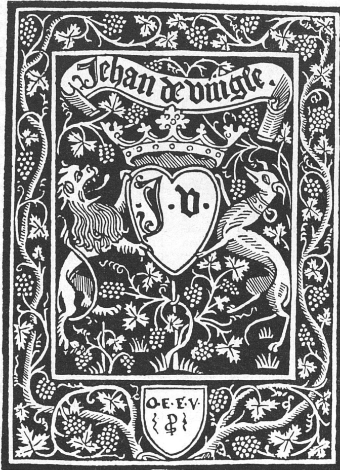
Wappenzeichen Lyon 1495