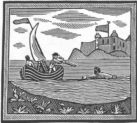
Englischer Holzschnitt aus einer illustrierten Robinson-Ausgabe des 18. Jahrhunderts